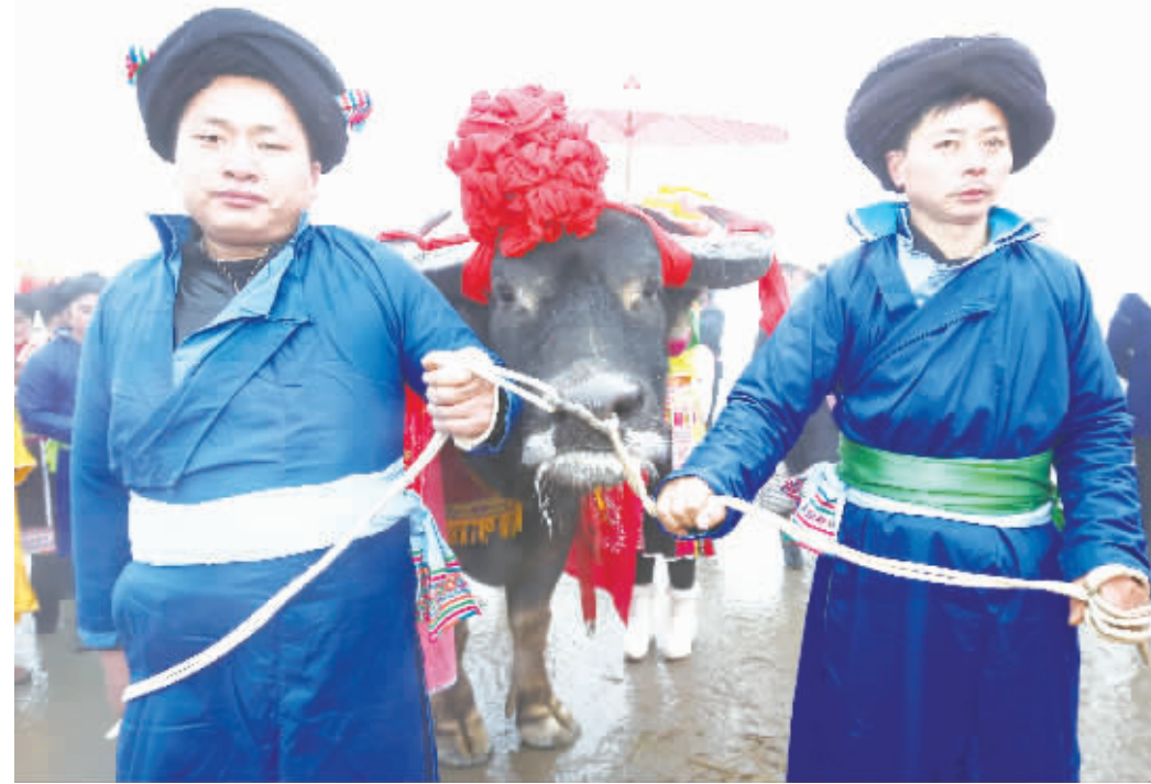
图为参加角牛踩场仪式的苗族同胞。