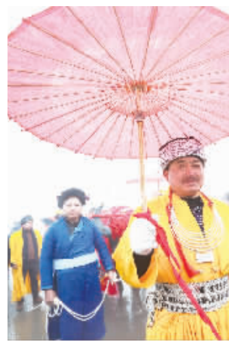
图为角牛踩场仪式。