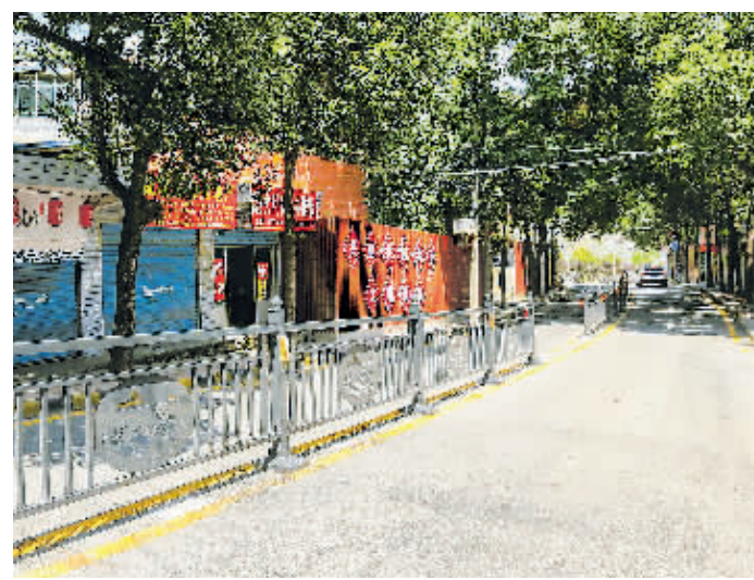
吉麟路车行道新铺了沥青。

安全感,溪北街道办事处将结合“三感社区”创建、爱国卫生运动等活动,联合各部门,围绕“治脏”“治乱”,继续对辖区的背街小巷开展硬化、绿化、亮化、美化等工程,扮靓“面子”,做实“里子”,切实解决群众关心、社会关注的城市痛点难点问题,把背街小巷打造成干净整洁、交通顺畅、优美宜居的风景线。