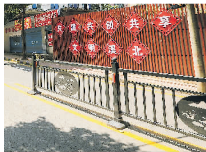
吉麟路新装的隔离护栏。