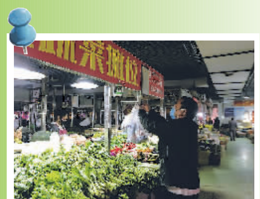
整洁干净的太慈桥农贸市场。