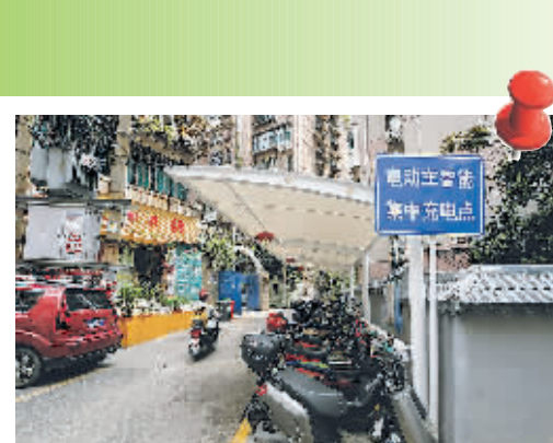
位于南明区电力巷的电动车集中充电点。