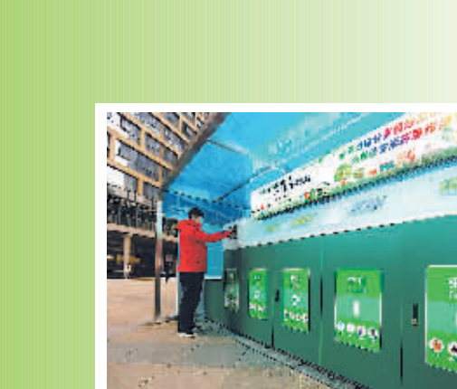
垃圾分类智能回收机在花果园投入使用。