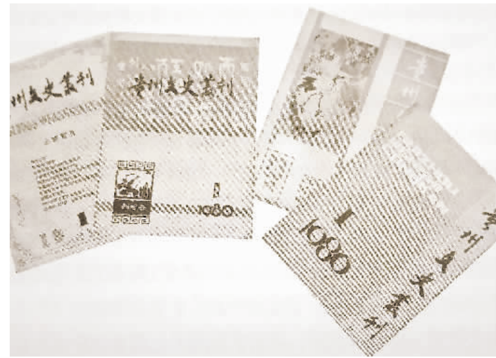
《贵州文史丛刊》创刊号。

编者也是沟通作者、读者的重要纽带，对文章作较大修改，一定要与作者商量；出刊后要多听取读者意见，使作者、编者和读者形成一个“朋友圈”。陈福桐先生身边就有许多相熟的作者，在先生的启发下，万方潜心沙