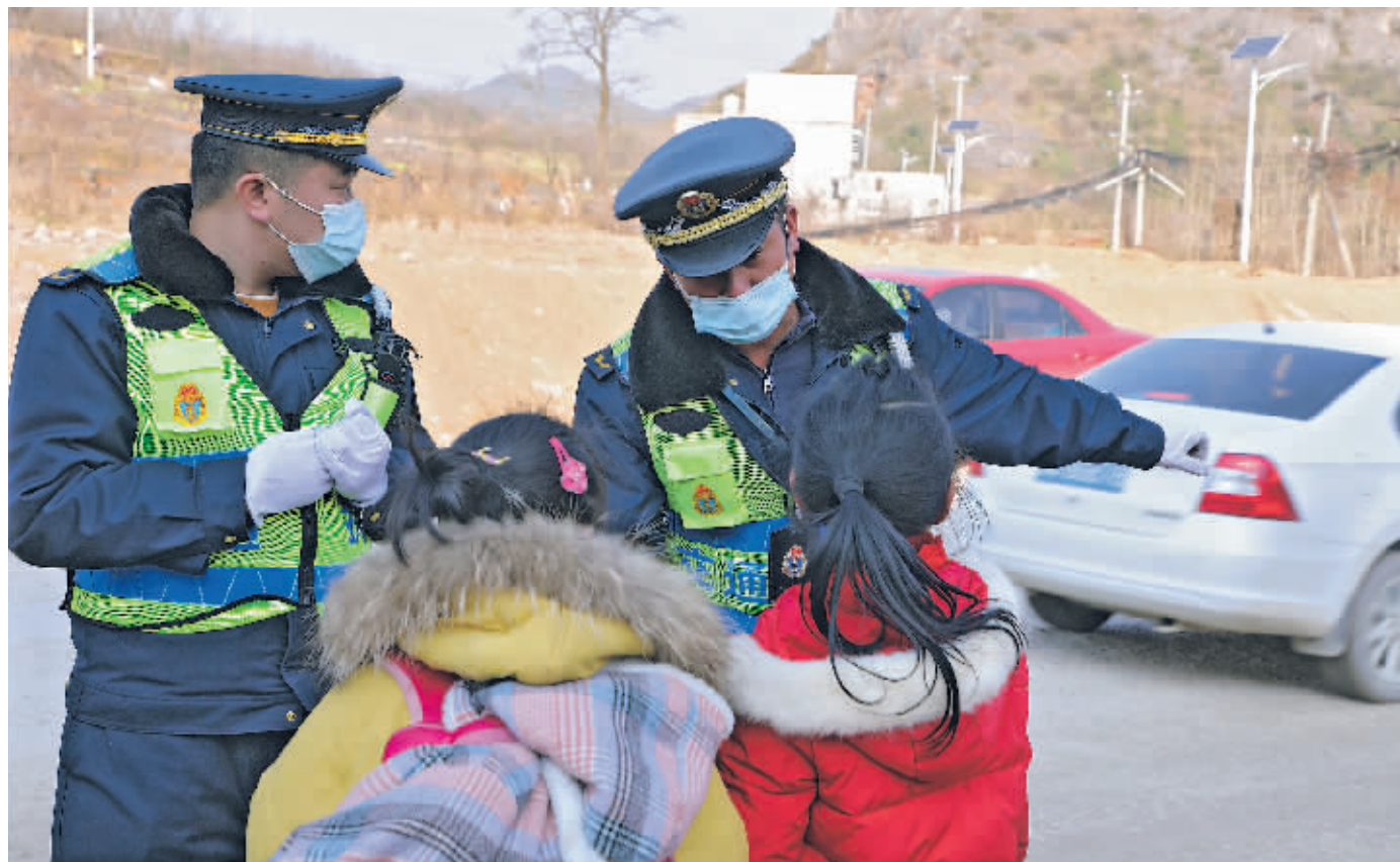
执法人员为学生讲解乘坐无牌无证和非法营运车辆的危险。