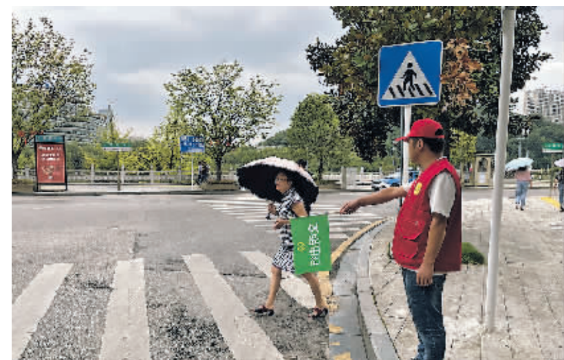
志愿者在引导行人过马路。

本报讯 连日来,贵阳高新区党政办公室(贵阳高新区文明城市巩固提升领导小组办公室)向全区发出志愿服务号召,号召辖区党员干部、企事业单位职工等开展文明劝导志愿服务,对不文明行为进行劝导,提升城市文明形象。据悉,志愿服务号召发出后,辖区内的党员积极响应,近70名“绿丝带”志愿者报名参与,这些志愿者在辖区10个主要路口开展轮流值守,重点对一些重复发生的、较为顽固的