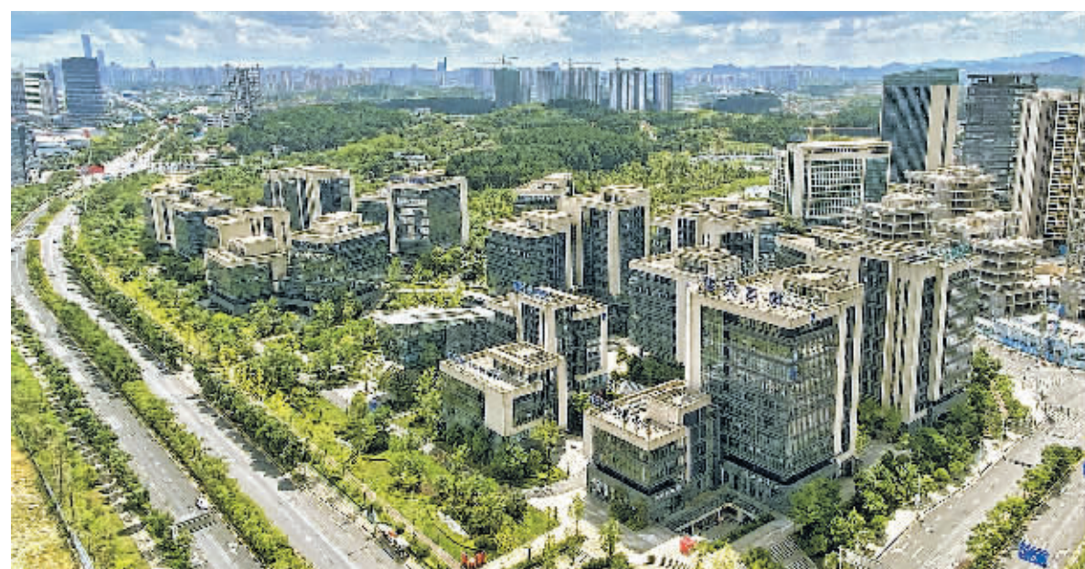
俯瞰贵州科学城·智谷。

华大基因(贵州)科技园入驻智谷2栋,贵州云上医学影像诊断中心入驻智谷5栋,贵州金域医学检验中心入驻智谷1栋,贵州国致科技人工智能机器人综合产业基地项目(一期)入驻智谷11栋,北京德眼科技集团有限公司入驻智谷6栋... 近年来,为助力贵阳贵安打造数据中心聚集区、电子信息制造业产业集群、软件和信息技术服务产业集群三个千亿级产业集群,贵阳高新区与南京软件园合作,将软件与信息服务作为经济高质量发展的重要支撑和数字经济发展的核心动力,着力构建一流的软件与信息技术服务产业集群,打造贵阳高新区智谷软件园。