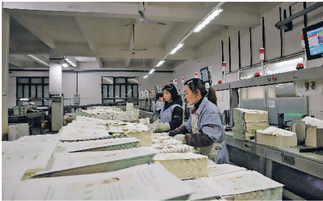
贵州新华印刷二厂工人在开展教科书印刷工作。

贵州新思维科技有限责任公司成立于2004年8月，是贵州高速公路集团有限公司下属三级公司。该公司立足高速公路机电运维业务板块，以打造技术咨询、系统集成、智慧养护等多元化服务体系的高新技术企业为目标。公司运维驻点共有50个，覆盖全省，复工后全体运维技术人员全力投入到高速公路各路段机电系统维护保障工作中。