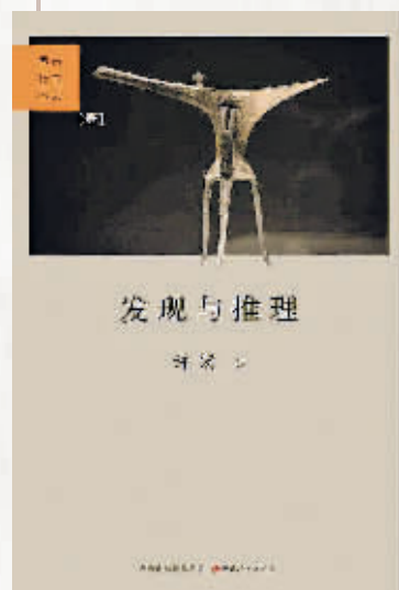
许宏 / 著, 山西人民出版社 2021年4月出版

入选榜单: 中华读书报2021年度十大好书,2021年度光明日报·阅读公社十大好书。 图书简介: 本书讲述作者亲历考古现场的见闻和体验,透视诸多考古事件背后的故事,呈现考古工作的复杂,以及考古人的甘苦,把一些考古发现及其争论探索过程娓娓道来。书中有九篇作者的考古亲历,涉及了丁公龙山文化、二里头都邑“不动产”、绿松石龙、中国最早青铜镜、偃师商城等重要考古发现;作者还在书中对秦代造船遗址、武威铜奔马、西晋周处墓铜片等考古史上有代表性的发现进行“重述”和评价。