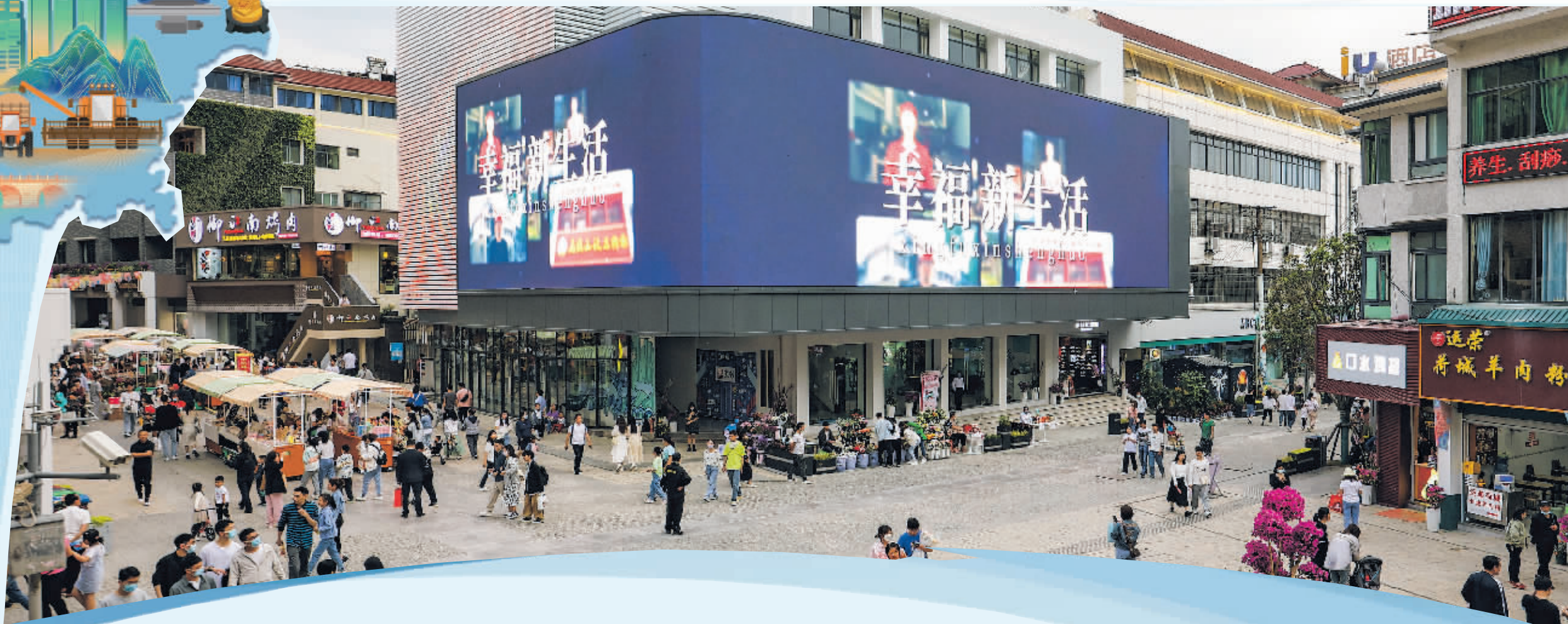
提升改造后的花溪十字街。