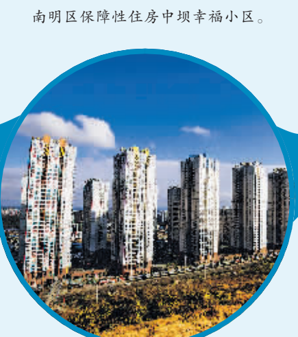
南明区保障性住房中坝幸福小区。