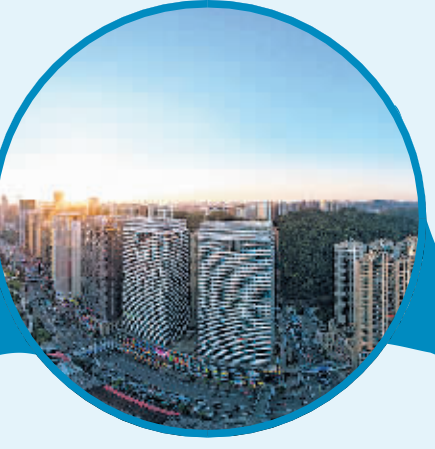
南明区花果园一角。