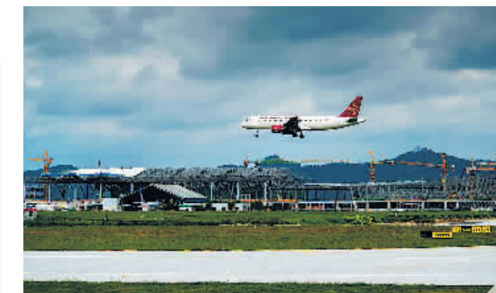
贵阳龙洞堡国际机场一景。