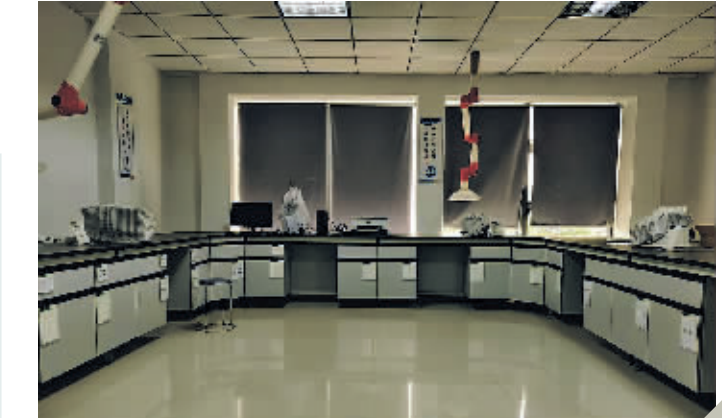
柏强制药有限公司实验室。