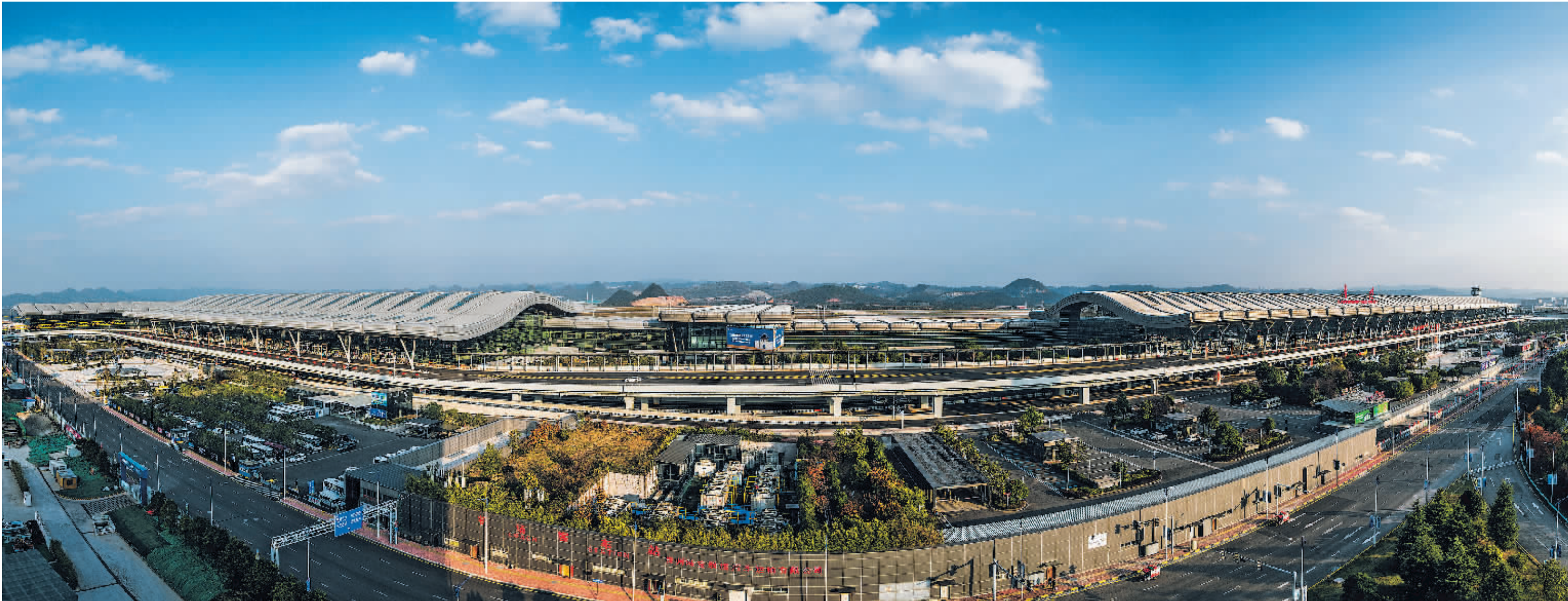
贵阳龙洞堡国际机场一隅。