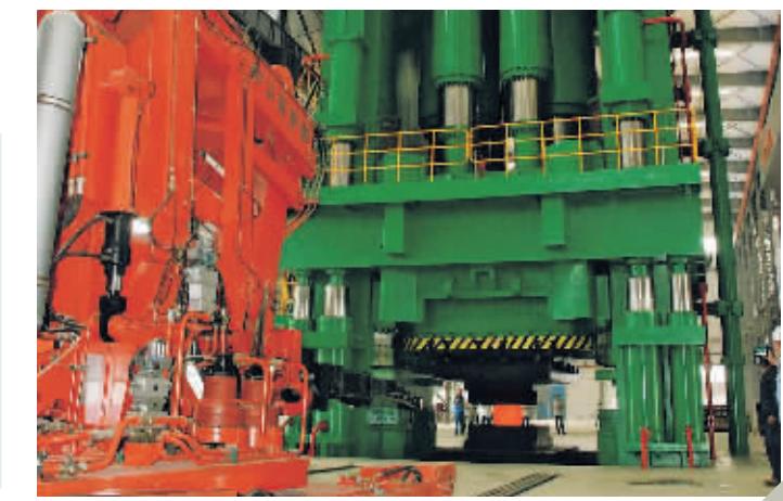
中航重机生产现场。