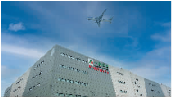
一树集团现代医药物流中心。

2023年,经济区将积极探索开展政务服务“2+1+1”、“贵人视频办”工作,扎实推进“一件事一次办”,全力推进政务服务“五个办”,深化政务服务“跨省通办”改革,深化“园区事园区办”工作,持续推进“放管服”改革,法治政府建设、招商引资、安全生产等工作任务,紧扣贵阳安“强省会”工作目标,为经济区高质量发展提供坚强政务服务保障。