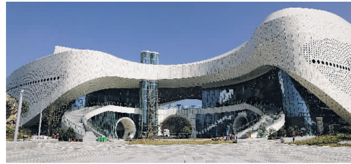
国际山地旅游联盟总部大楼。

制,要求各级各部门包保领导和责任部门主动为企业提供上门服务,帮助企业解决具体困难,原则上每月主动上门服务不少于2次,每月工作调度不低于2次。