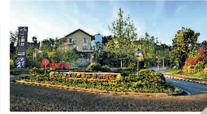
中铁国际生态城太阳谷康养示范区。