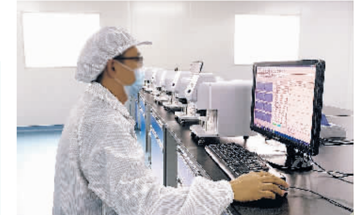
金玖生物公司工作人员进行产品测试。