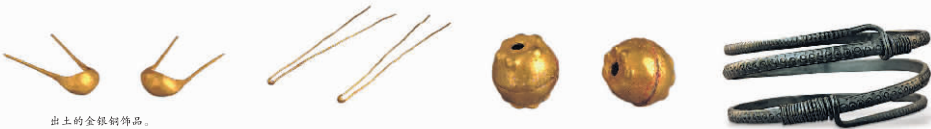
出土的金银铜饰品。