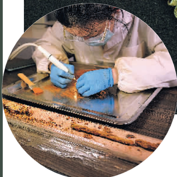
工作人员聚精会神地修复发掘出来的文物。

作为全国罕见的大型地方民族公共墓地,贵安新区大松山墓群创下多个“首次”,让我们一起去揭开它的神秘面纱。