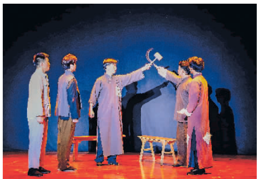
《息烽·息烽》在贵阳市委党校演出场。

本报讯 5月5日晚,红色剧目《息烽·息烽》进党校课堂首场教学活动在中共贵阳市委党校举行,市委党校2023年春季主体班全体学员观看演出。