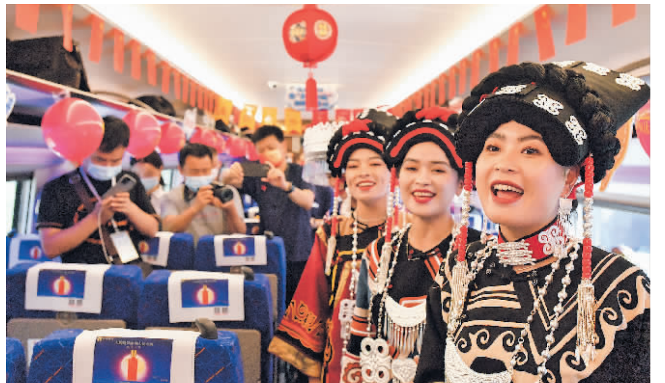
2021年9月26日,贵州省毕节市赫章县的彝族演员在C6012次贵阳北开往贵阳北的“多彩环线”复兴号动车上为旅客演唱彝族民歌。

游设施,贵阳环线铁路就是其中之一。2022年3月30日,首列环线铁路C5802次列车投入运营,标志着贵阳环线铁路全线通车,贵阳成为首个进入城市环线铁路时代的省会城市。环城一圈最快1小时26分,途经贵阳北、贵阳、双龙南、孟关、花溪南、花溪大学城、党武、天河潭、湖潮东、芦官、贵安、花溪西、金华镇、金阳南、金阳、白云西、白云北等17个车站,串起贵阳贵安各景区,“乘坐环城快铁,打卡市郊景点”成为贵阳假期旅游的一大亮点。同时,城市环线铁路也实现以贵阳为中心,连接遵义、安顺、毕节、都匀、凯里等中心城市的1小时铁路交通圈。