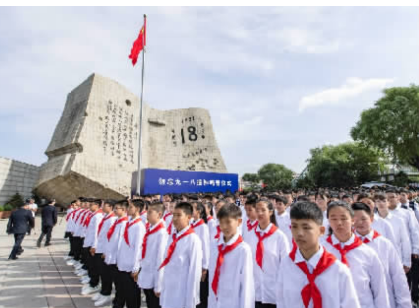
图为9月18日拍摄的勿忘“九一八”撞钟鸣警仪式现场。

新华社沈阳9月18日电 今年是“九一八”事变爆发92周年。18日上午,社会各界人士在沈阳隆重集会,举行撞钟鸣警仪式,以铭记历史、缅怀先烈。