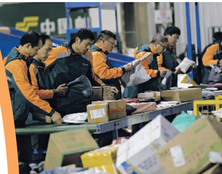
▲2023年11月12日,工作人员在中国邮政集团有限公司湖南省永州市道县分公司邮件处理中心分拣快递包裹。

中国驻美大使谢锋表示,“中国经济崩溃论”一再崩盘,“中国经济见顶论”毫无事实根据。不管是关税战、科技战、认知战,都阻挡不了中国高质量发展的脚步。