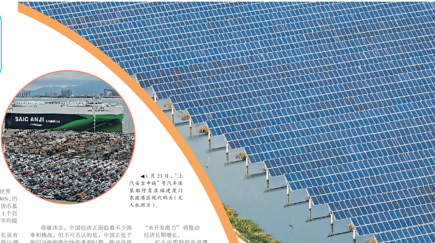
▲1月23日,“上汽安吉中诚”号汽车滚装船停靠在福建厦门东渡港区现代码头(无人机照片)。

近段时间,一些西方媒体和智库以“只见树木,不见森林”的眼光,对中国经济展开新一轮“唱衰”,鼓噪“中国经济见顶论”。