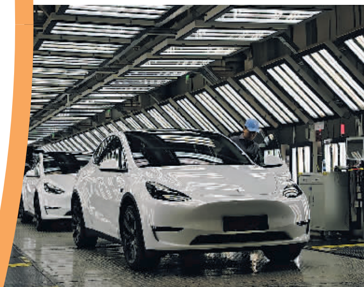
▲2023年12月22日,在特斯拉上海超级工厂内,工人在对出厂前的车辆进行漆面及门窗检测。

针对所谓“供应链转移”的论调,美国智库彼得森国际经济研究所高级研究员加里·赫夫鲍尔对记者表示,中国的许多产品不仅价格优惠,而且质量好、交货快,一些人排斥中国产品的企图不会成功,“供应链转移”的结果是雷声大、雨点小。