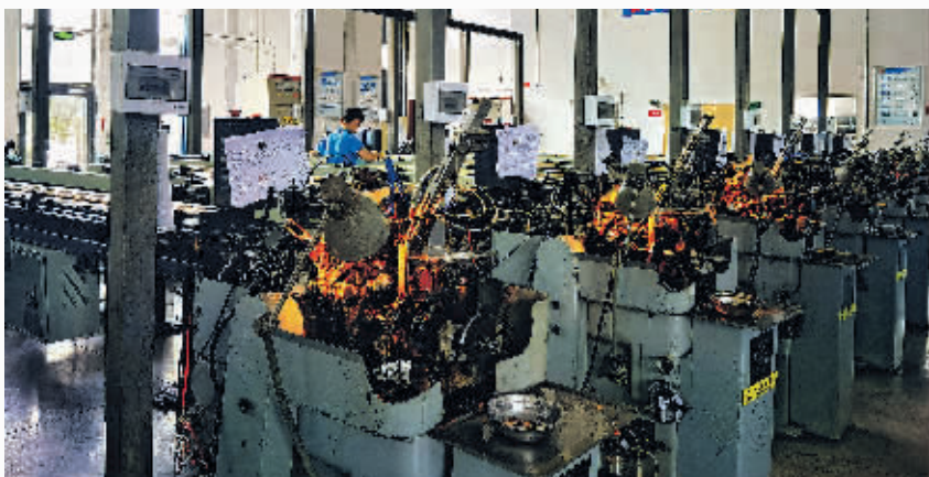
东江科技的生产车间。