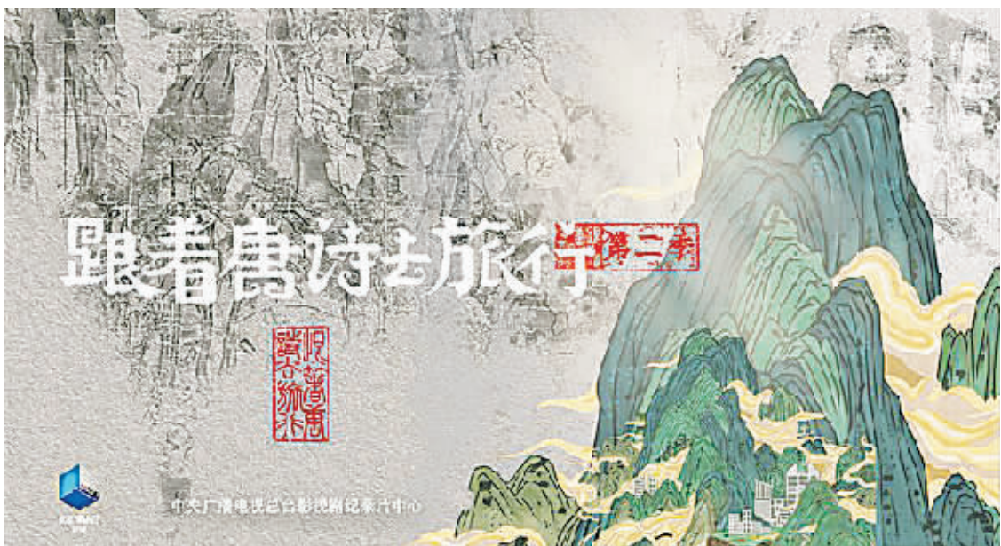
《跟着唐诗去旅行》(第二季)宣传海报。

人文纪录片《跟着唐诗去旅行》(第二季)正在央视纪录频道播出，节目把大众记忆深处的唐诗作为旅行指南，前往祖国壮阔山河寻找唐诗诞生的现场、触摸唐代诗人的内心世界，这段充满诗意的文化之旅也与当下的文旅热潮相互呼应。