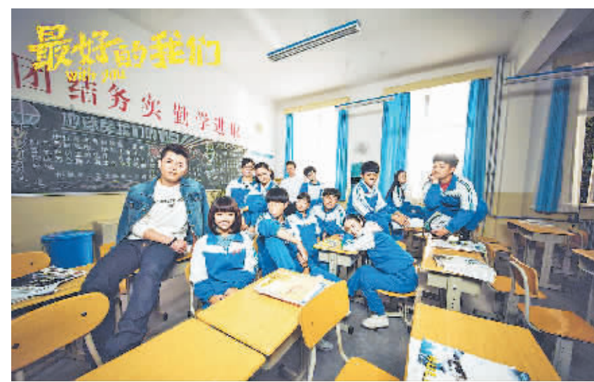
《最好的我们》宣传海报。