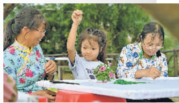
一名小朋友在学习刺绣。