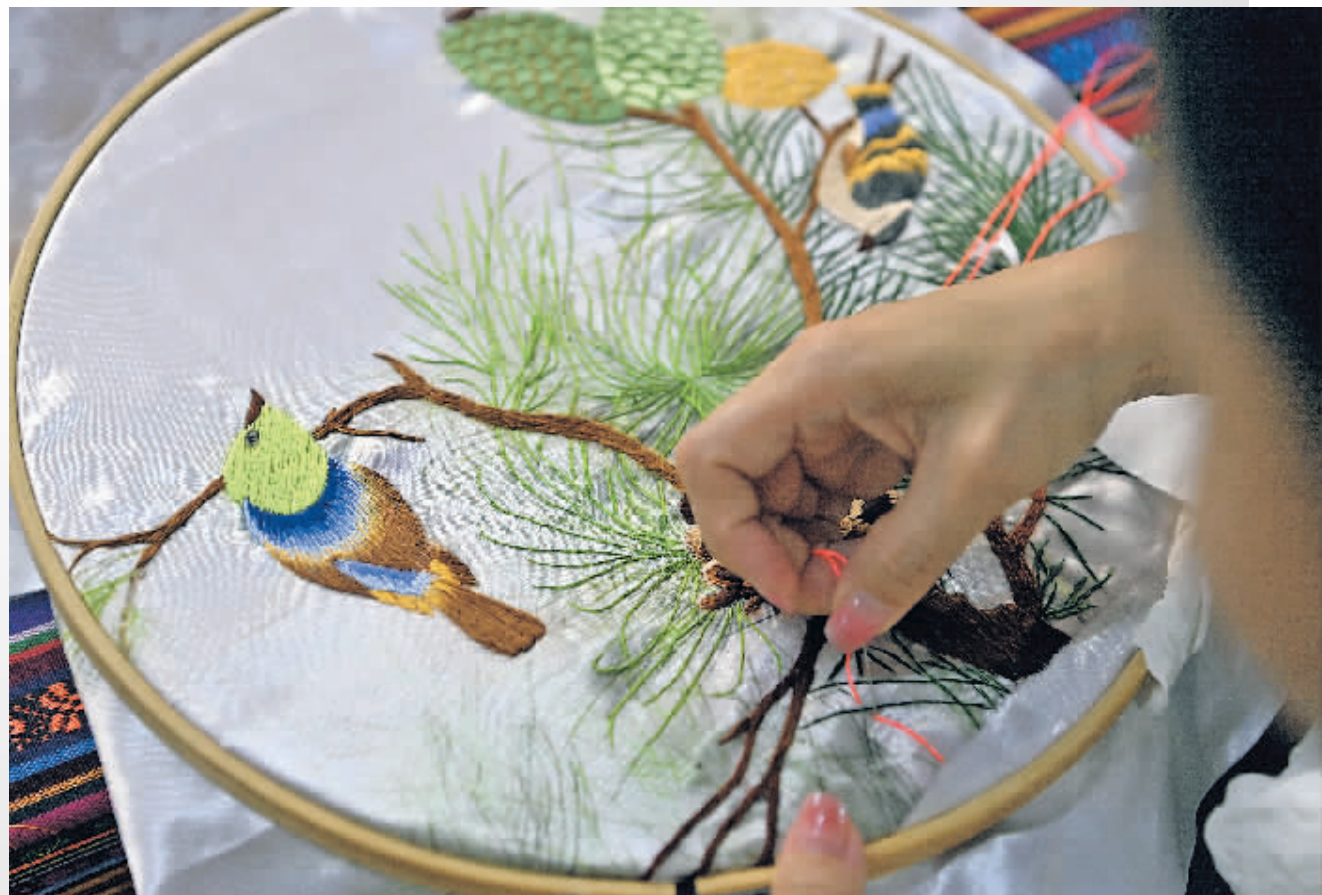
制作中的七里刺绣。