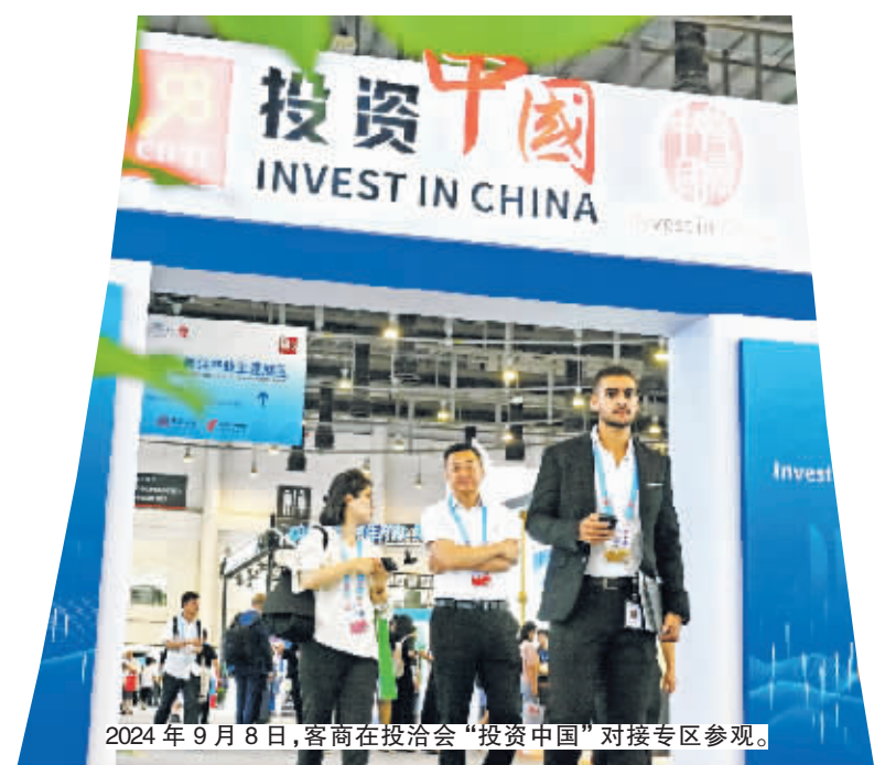
2024年9月8日,客商在投洽会“投资中国”对接专区参观。