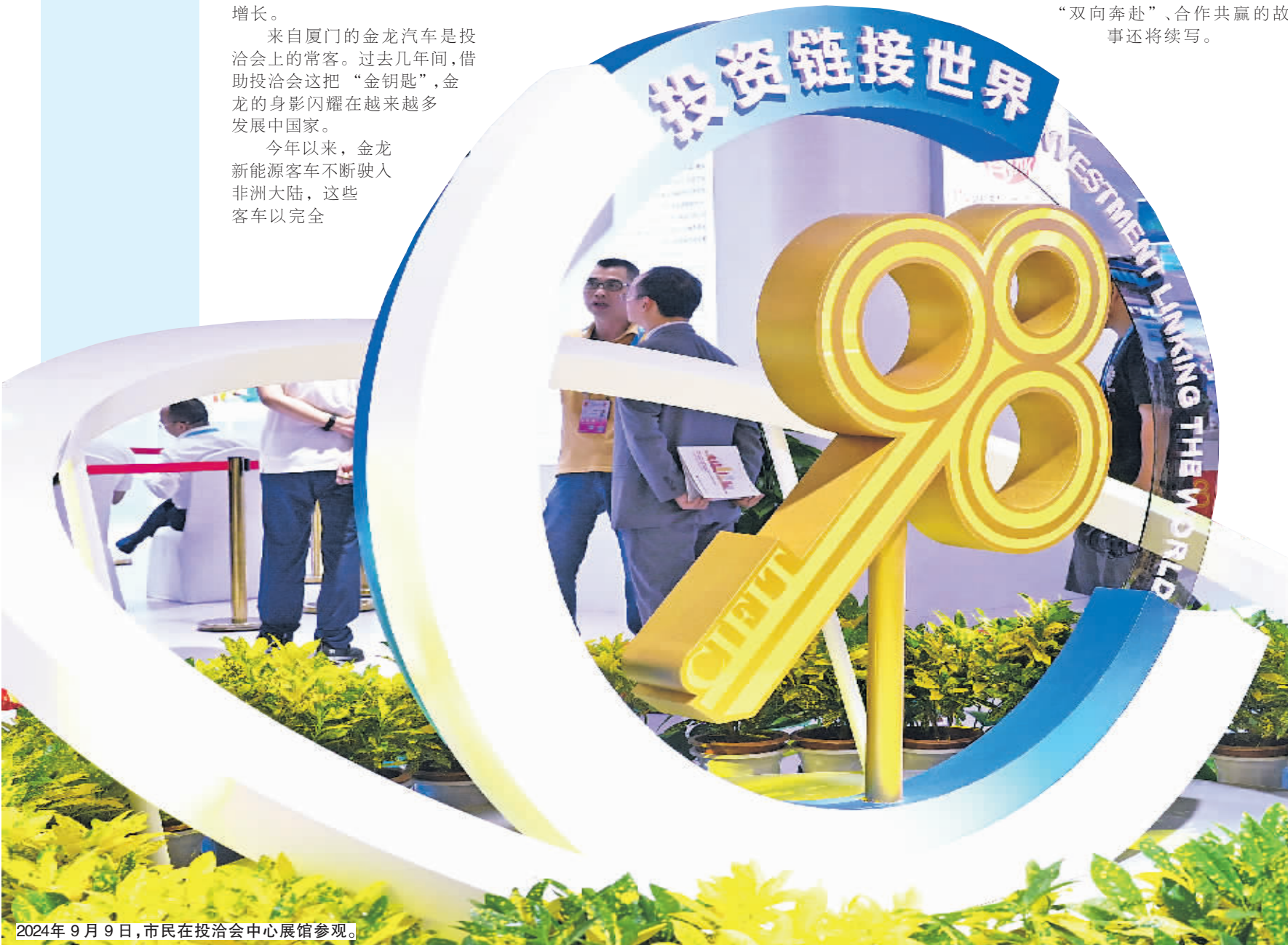
2024年9月9日,市民在投洽会中心展馆参观。