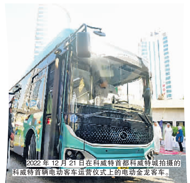
2022年12月21日在科威特首都科威特城拍摄的科威特首辆电动客车运营仪式上的电动金龙客车。