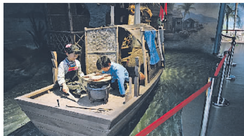
海南疍家博物馆位于海南陵水,是综合性疍家文化主题博物馆。该馆于2023年9月开馆,致力于收藏、记录与传播疍家人的人文与历史。疍家,是一个视水为陆、以舟为室、浮游江海的群体,广泛分布于中国南方沿海和江河湖口地带。疍家人特殊的生产、生活环境,形成了迥异于陆上居民的水上社会。