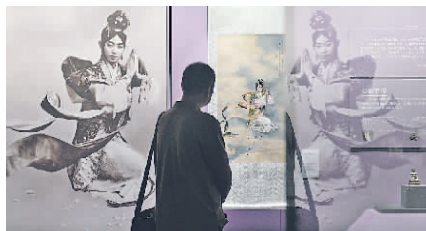
9月12日,由文化和旅游部恭王府博物馆与梅兰芳纪念馆联合主办的“纪念梅兰芳诞辰130周年:九晚华安——梅兰芳戏曲表演手势展”在北京恭王府博物馆开幕。本次展览以梅兰芳纪念馆藏梅兰芳手势照片为基础,结合文物文献及当代以梅兰芳手势为主题的再创作作品,展现梅兰芳情思起伏、气韵万千的手势艺术之美,彰显京剧神韵。