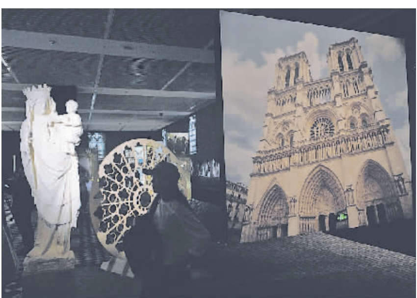
观众在参观展览。