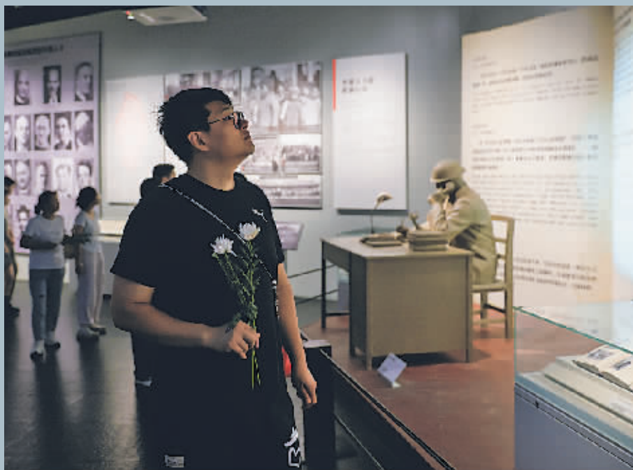
9月18日,人们参观侵华日军南京大屠杀遇难同胞纪念馆。