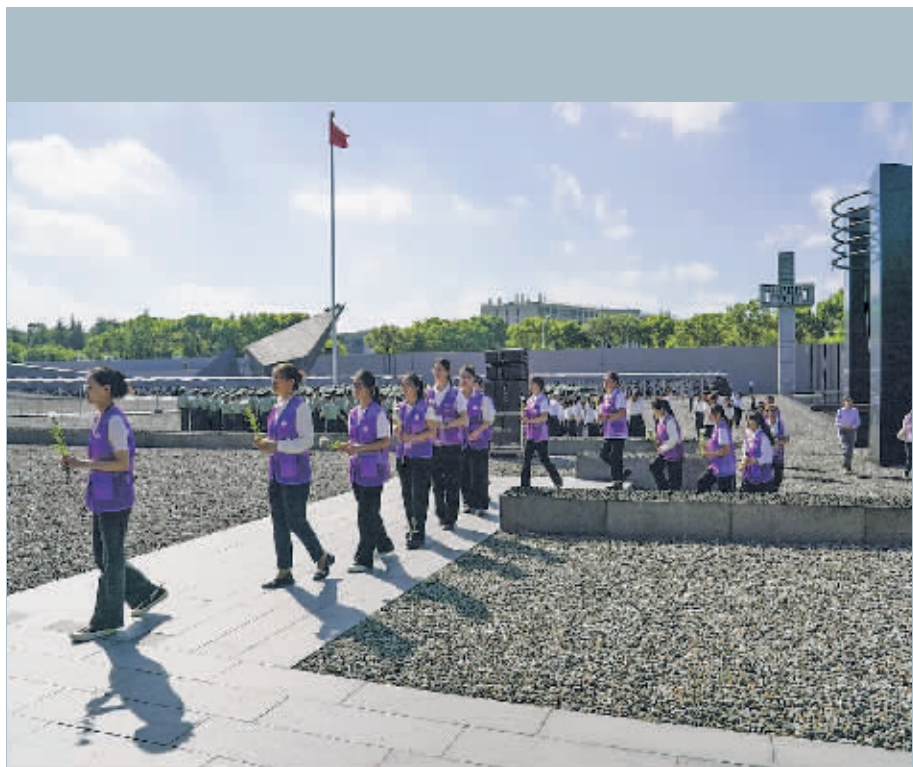
9月18日,在侵华日军南京大屠杀遇难同胞纪念馆,社会各界代表排队献花。