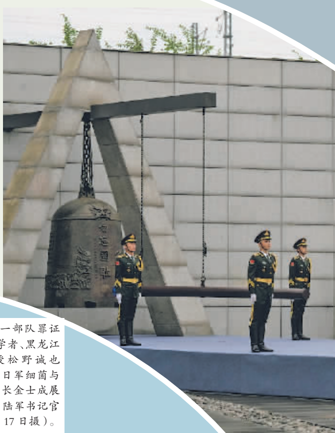
9月18日上午,“勿忘九一八”撞钟鸣警仪式在沈阳“九一八”历史博物馆残历碑广场举行。图为撞钟鸣警仪式现场。