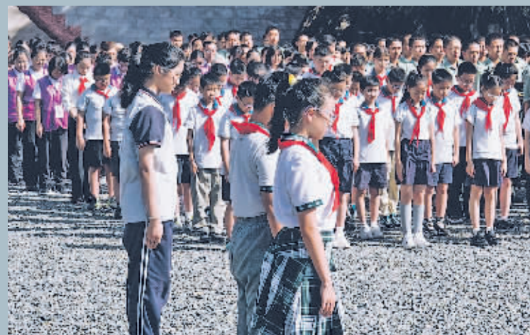
9月18日,在侵华日军南京大屠杀遇难同胞纪念馆,人们向遇难同胞默哀。