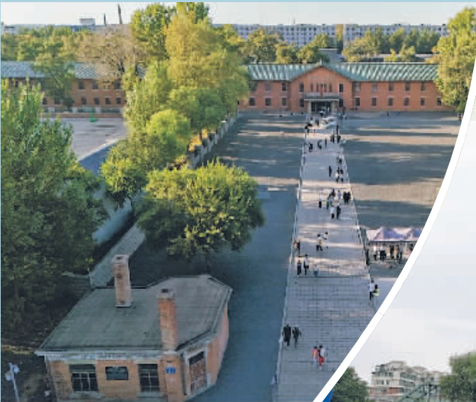
9月17日,人们前往侵华日军第七三一部队本部主楼旧址参观(无人机照片)。