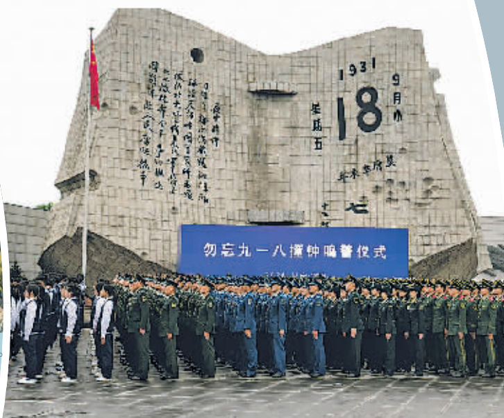
9月18日拍摄的“勿忘九一八”撞钟鸣警仪式现场。