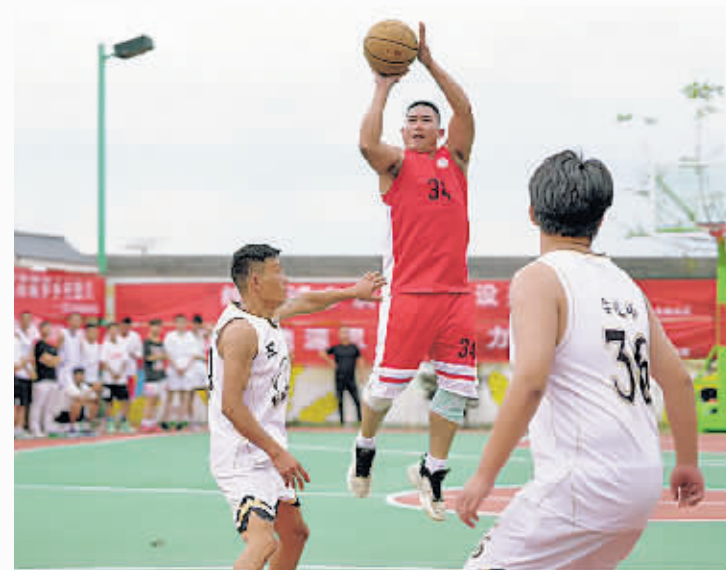
9月22日，茅草村代表队与商会代表队在改造后的篮球场进行友谊赛。