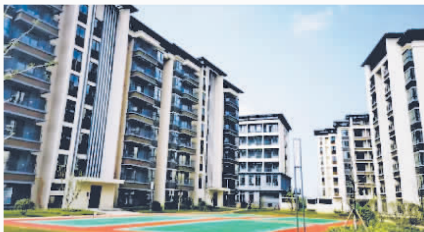
贵安生态新城保障性租赁住房项目一角。

该项目位于湖潮乡，紧邻金马大道（现数谷大道）与望舒路交会处，规划总用地面积约62亩，净用地面积约41亩，总建筑面积超过55000平方米。建设内容包括保障性住房、商业、公建配套、幼儿园、停车场等。待项目投入使用后，将为521户家庭提供安居之所，并为180名幼儿提供教育资源，助力改善贵安新区城市居民的居住条件。