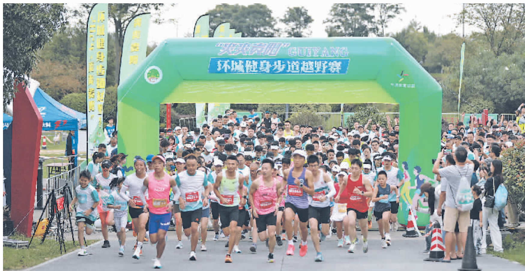
9月21日，2024“爽爽贵阳”环城健身步道越野赛贵安站鸣枪开跑。

本报讯 9月21日，2024“爽爽贵阳”环城健身步道越野赛贵安站在月亮湖公园开赛，省内外近600名选手参加。赛事设置22公里“月亮组”、12公里“月亮组”和3.3公里“星星组”。其中，“月亮组”和“星星组”为竞赛组，考验参赛选手的速度和耐力；“星星组”为亲子组，沿途设置老虎下山、独木桥、匍匐前进等多处趣味障碍点。