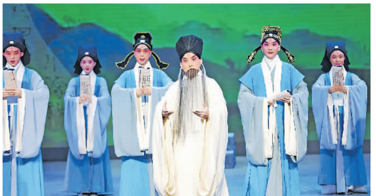
研讨会开幕式上的《阳明悟道》节目表演。

与会专家学者一致认为,习近平文化思想深刻回答了新时代我国文化建设举什么旗、走什么路、坚持什么原则、实现什么目标等根本问题,是铸就中华文化新辉煌的行动指南和根本遵循。当前,贵州正全面深入贯彻落实习近平文化思想,提出奋力打造习近平文化思想生动实践地、加快建设多彩贵州文化强省的战略目标,大力实施红色文化重点建设、阳明文化转化运用、民族文化传承弘扬、屯堡文化等历史文化研究推广“四大文化工程”,赓续文化基因,厚植文化自信,以新气象新作为努力开