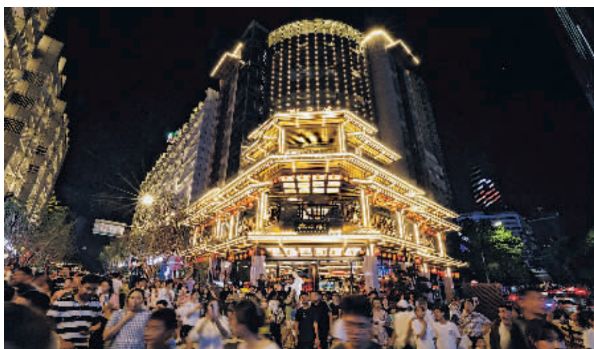
市民、游客在曹状元街区游玩。

南明区的“一河一道一片”是贵阳市城市文脉的核心区域,分布的文化遗存集中、覆盖的历史朝代久远,包含的文化类型多样、蕴藏的精神价值巨大,在贵阳市文脉体系中极具典型性、代表性和重要性。