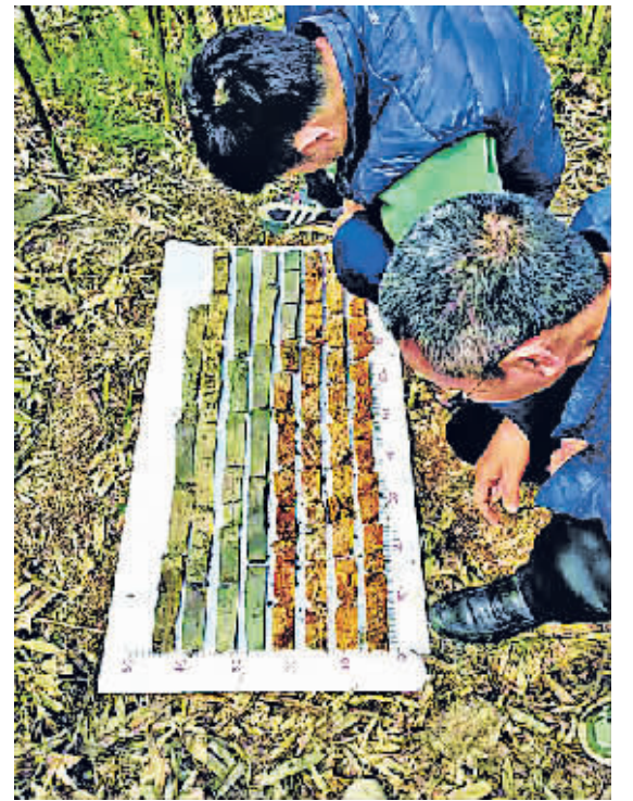
团队成员在查看探孔钻芯。