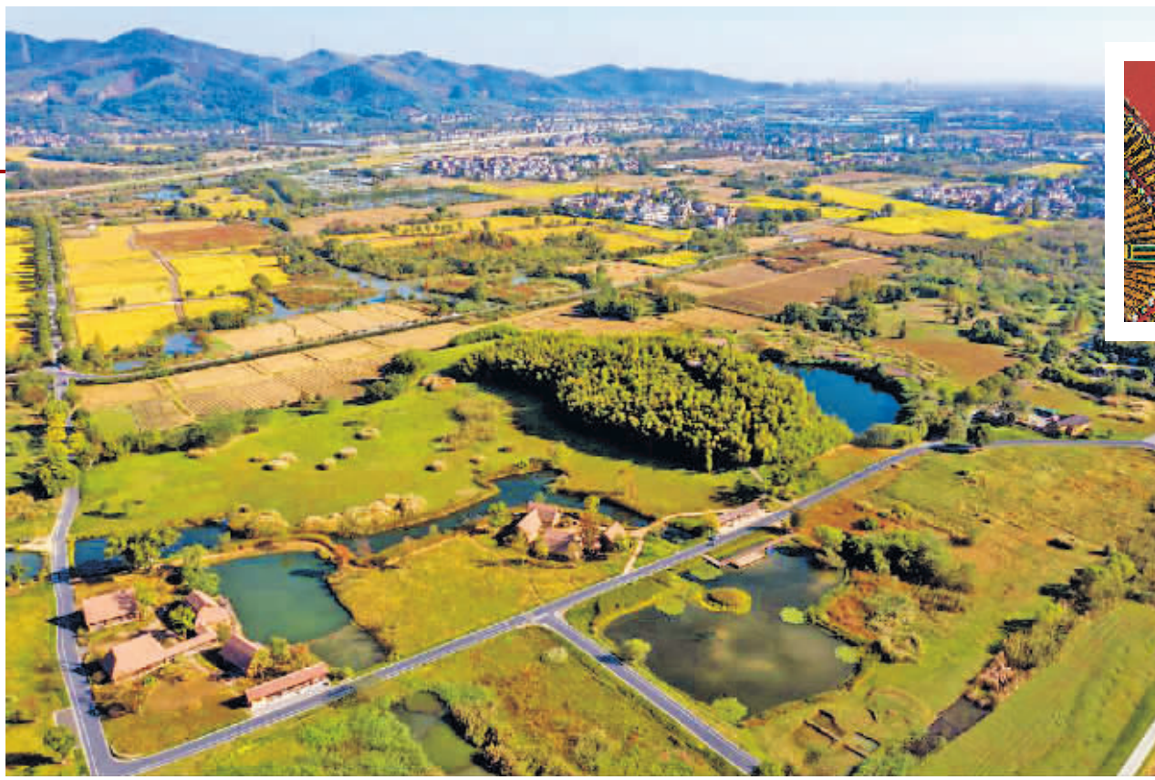
空中俯瞰良渚古城遗址公园。