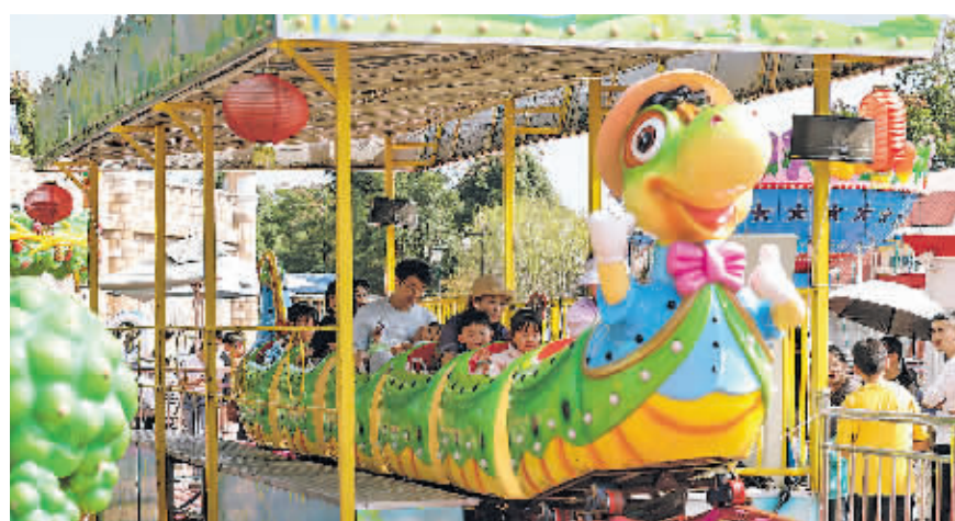
10月4日,游客在云漫湖景区游玩。

了丰富的节日活动,给游客带来新体验。在云漫湖景区,国潮创意打卡、涂鸦、创意合影、小丑巡游等限时活动为广大游客带去别样欢乐。国庆假期,游客还可通过关注云漫湖景区微信公众号,并转发推文至朋友圈集赞免票入园。“孩子们特别喜欢小丑巡游,还说希望每次假期都能来贵安玩。”来自重庆的游客王馨说。贵安新区北斗湾·贵州六月六风情街