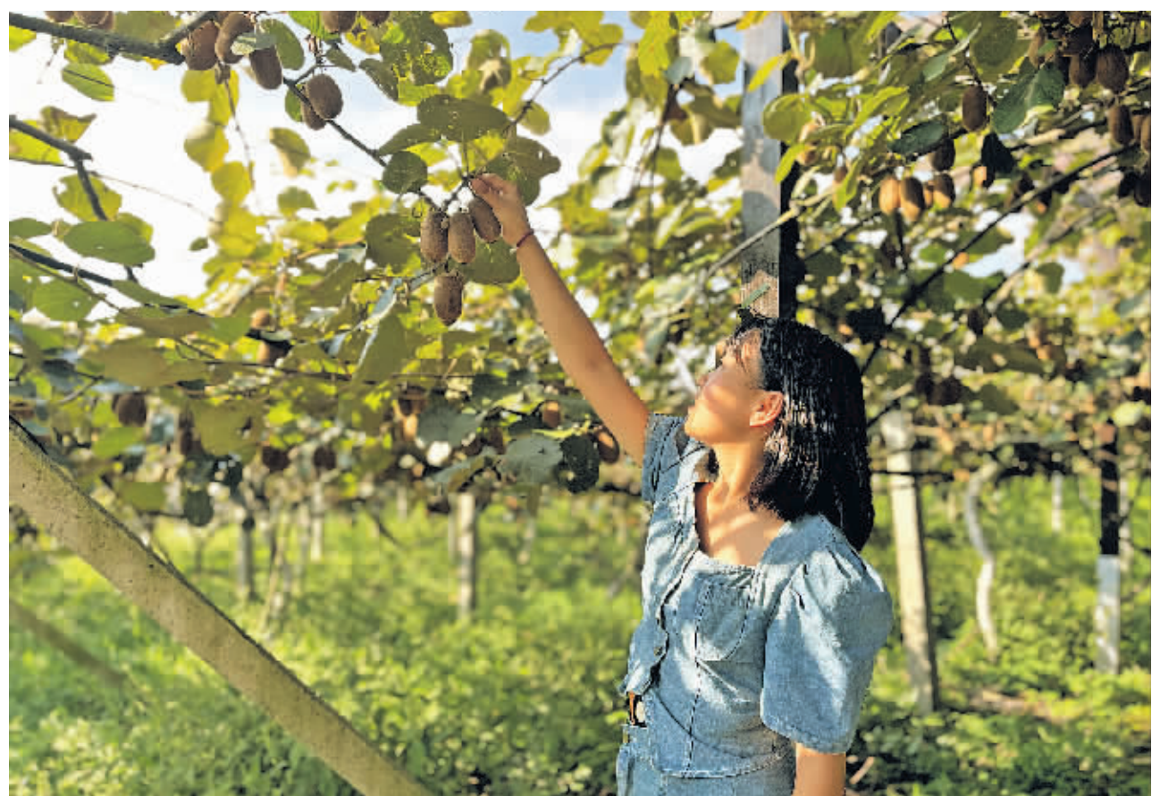
修文县谷堡镇平滩村村民在查看猕猴桃的成熟程度。

猕猴桃可以采摘了,我们会安排技术人员到基地对猕猴桃的果型、果色、甜度等进行检测,公司保底收购合格的猕猴桃。”修文国投集团销售总监方啸说,集团通过使用大数据物联网可追溯系统云平台,让猕猴桃产销全程有据可依。