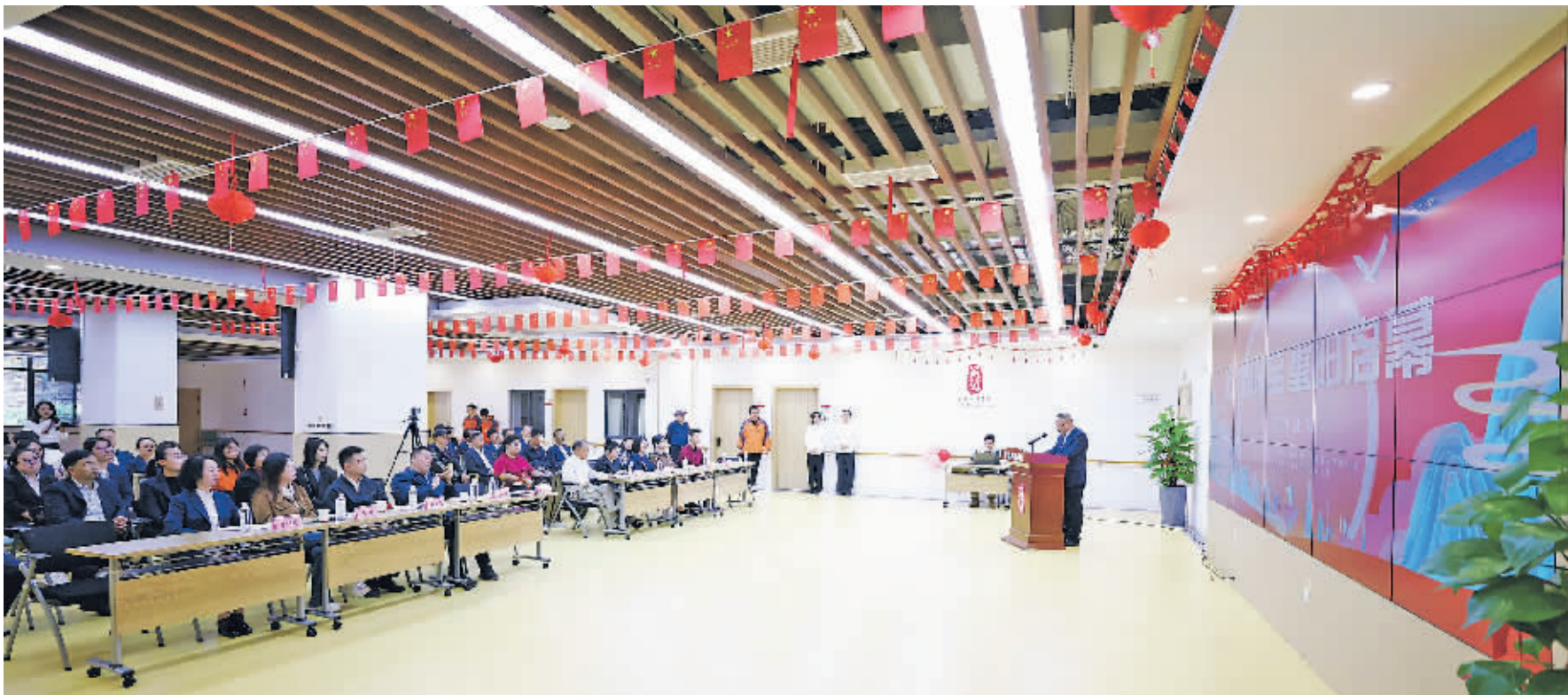
贵阳工商养老产业投资发展有限公司“七福同至启重阳 阔步颐养新征程”重阳节系列活动暨贵州省养老服务行业协会“敬老爱老·大孝贵州”系列活动启动仪式现场。

活动过程中,来自贵阳工商养老文娛中心的演员们穿插表演了舞蹈、合唱等精彩文艺节目。