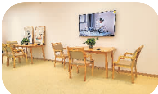
瑞花社区养老服务站观影区。