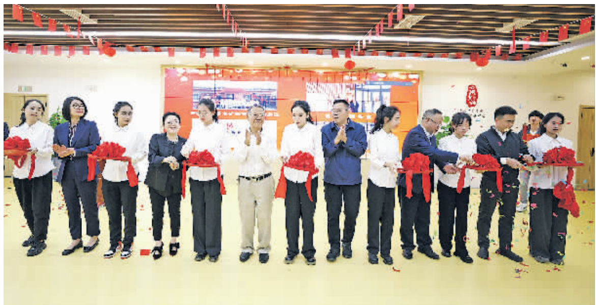
贵阳工商养老七个为老服务项目剪彩揭牌。