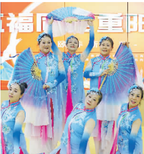
活动现场的舞蹈表演。

下一步,贵阳工商养老将以此为新起点,不懈探索优化,在养老领域构筑更加专业、规范、精细、优质的标准化服务体系,为贵阳贵安广大老年人安享家门口的幸福晚年提供坚实支撑。