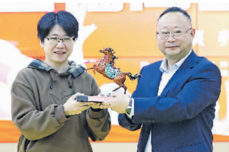
广州越秀银丰集团运营中心负责人(左)向贵阳工商养老赠送CARF认证通过贺礼。

活动期间,将举办贵州省养老服务行业协会2024学术交流会;号召所有会员单位开展“零距离”免费5天入住体验活动,让老年群体和家属直观体验、了解养老机构;省养老服务行业协会旅居专委会委托专家学者不定期到各市(州)开展旅居探访工作,为建立“全省旅居一盘棋”的发展格局奠定基础;委派相关专家和教师开展职业技能培训等。