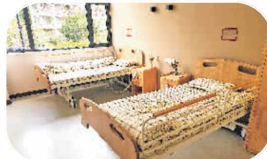
后巢乡(山水黔城)养老服务中心的床位。

贵阳工商养老矿山苑医疗病房区 该项目利用花溪区平桥社区卫生服务中心原医疗病房设施,设置医养床位6张,运用养老床位和医疗床位转换入住方式,探索更有效的医养结合新模式。