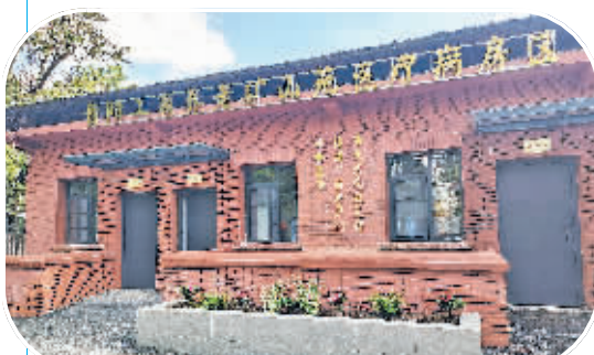
贵阳工商养老矿山苑医疗病房区一角。