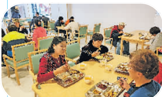
老人在广寒宫药食同源主题社区食堂用餐。