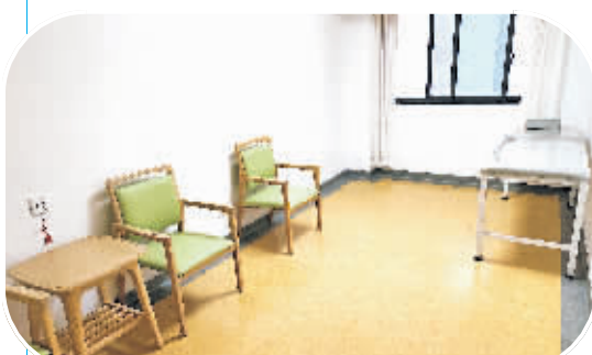
营盘路养护院医务室观察室。