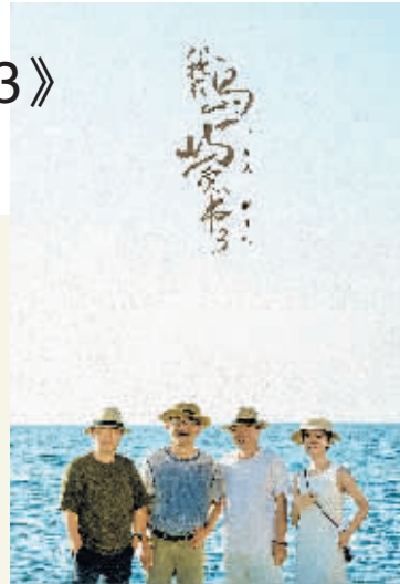
《我在岛屿读书3》宣传海报。

四川回溯起初去希腊拍摄时的兴奋心情，“去希腊之前，脑海里那些艺术家、诗人的名字就只是名字。到了希腊之后，这些名字跟希腊这片土地联系在一起了，把过去阅读中的内容跟这块土地的关系铸得更牢。”