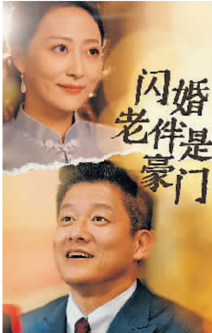
《闪婚老伴是豪门》宣传海报。

巨大的市场前景，对应的是相对匮乏的内容供应。在花卷看来，“小朋友有迪士尼，年轻人有漫威和好莱坞，而老年人有