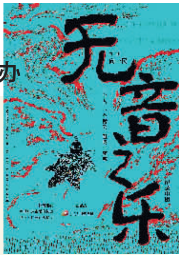
《无音之乐》宣传海报。