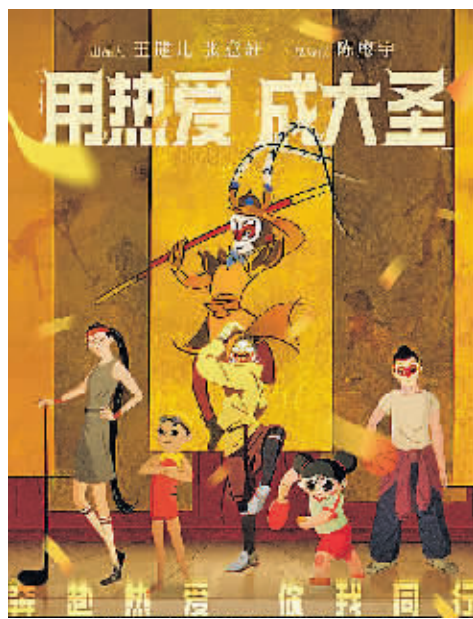
《奔赴热爱》宣传海报。

以艺术共创为源头活水，以最新技术为助力，以丰富的营销、传播玩法为途径，上影元为《大闹天宫》这一经典IP赋予更多具有时代特色的文化及商业价值，也为讲好中国故事、传承中国传统文化打开了新思路——传统文化的传承离不开与时代的共振，只有通过时代情绪的深入洞察和对新世代生活方式的理解，经典IP方能在新时代挖掘出新表达，焕发出新魅力。