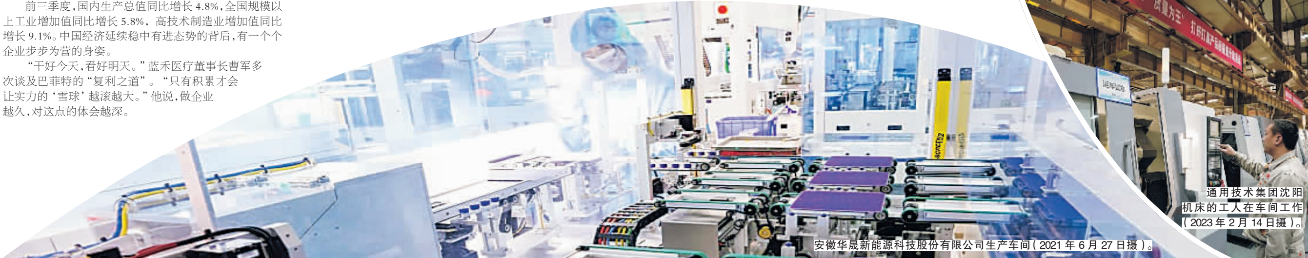
安徽华晟新能源科技股份有限公司生产车间(2021年6月27日摄)。