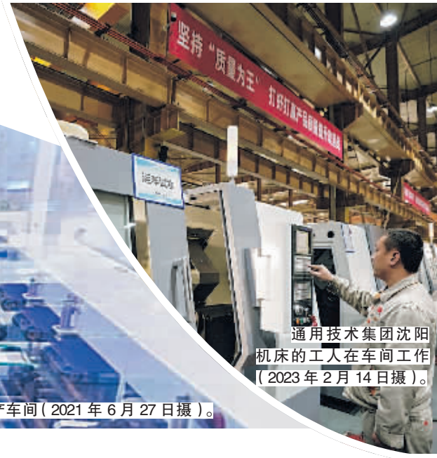
通用技术集团沈阳机床的工人在车间工作(2023年2月14日摄)。