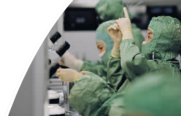
在赛诺医疗科学技术有限公司天津生产基地,工作人员在导管制备室车间组装球囊导管(2024年9月9日摄)。

成为主流芯片厂商的核心供应商,全球市场占有率达到38%——在高纯金属溅射靶材领域,江丰电子拥有自己的话语权。 高纯金属溅射靶材是决定芯片性能的关键材料,对金属纯度、溅射技术、制造工艺等要求极为苛刻,我国在这个领域曾长期处于空白。 2005年,已受聘担任一家世界500强企业日本工厂负责人的姚力军毅然选择回国,创立江丰电子,向做出国产溅射靶材发起进攻。 零的突破异常艰难。不仅有技术的壁垒,还面临进入供应链的挑战与竞争对手的出击。最困难时,一家跨国公司甚至把签约好的收购合同放在姚力军面前。 “外界都认为我们‘翻不了身’,但我们就是要做别人没做过的事,走没走过的路。” 瞄准一个领域不断冲锋,16年攻克12英寸靶材的核心技术,10年突破HCM异形靶材的核心技术……凭借对核心技术的突破,江丰电子打破国外企业在这一领域的垄断,把“卡脖子”短板一点点变成可以参与国际竞争的长板。 创造力,是我们的生命力,发展的动力源。中国经济越是向高质量攀升,中国制造业是在一些关键赛道处于领跑优势,对创造的要求就越高。 当创新创造成为各界共识,如何实现“人无我有”,怎样做到“人有我优”,一个个企业在思考、在实践。 胖东来火了。 游客打卡、企业“研学”,刚过去的十一假期,这家商超成为河南许昌的一道“风景线”。 当传统商超吸引力减弱,胖东来何以“引客来”? 新零售——高人气背后,是从经营理念到管理模式的蜕变。把立足点放在人上,从代驾停车、宠物寄存到为老人提供老花镜、免费煎中药,细节背后是精细管理和极致服务;把出发点放在事上,建立严格的供应商筛选评估机制,打造独立产业园,高效的供应链里有着做产品的思维。 “如果不能提供高品质的商品和服务,怎么给顾客创造高品质的生活?”企业董事长于东来说,从常规经营走向品质经营的过程,是对商业链条的重塑,是企业价值、文化的创造。 新技术、新产品、新业态、新的生产模式……记者一路走、一路看,有突破“卡脖子”的大变革、大创造,也有“润物细无声”的改良改进、完善提升,压力和挑战不断激发中国企业对创新的渴望,鼓舞中国企业寻求突破的信念。 步入工厂车间,“云上中国”新风扑面: 工业互联网覆盖全部工业大类,以大模型为代表的人工智能正应用到钢铁、汽车等领域; 走进产业园区,新质生产力孕育勃发: 178家国家高新区竞逐新兴产业、未来产业;从东北地区到粤港澳大湾区、“天空之城”布局发展“低空经济”,“蓝海”的水开始沸腾…… 从一链一策打造自主可控的产业链,到建设一批中试验证平台,建立全国统一、部省联动的独角兽企业培育体系,发展耐心资本,持续加力的举措不断优化创新创造的环境。 46.3万家高新技术企业、超14万家专精特新中小企业……一个个向“新”而行的企业,正奋力飞向更广阔的蓝天。 获得新一批“小巨人”称号,工大卫星总经理曲成刚来不及庆祝便投入新的研发。他坦言,卫星产业以“研值”论英雄,“创新的步伐要再快点”。 赛诺医疗新一代支架正申请美国食品和药物管理局批准,董事长孙箭华立志,在更激烈的“赛场”与国际品牌一较高下。 希迪智驾CEO马维决心持续打磨技术和产品,“如果每个行业都有一批深入扎根的企业,经济的韧性将更凸显”……不惧风雨,逐浪前行。 中国企业如此,中国经济亦然。