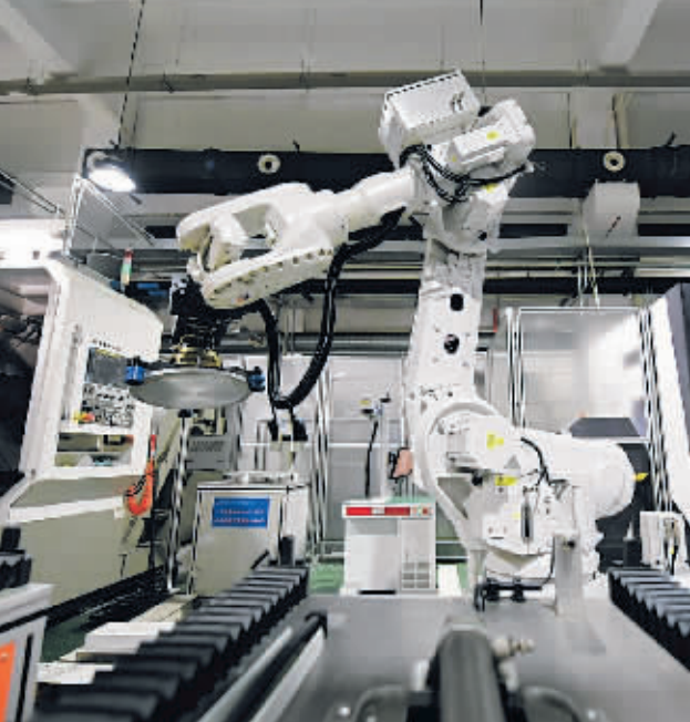
在浙江宁波江丰电子材料股份有限公司分析检测中心,工业机器人在自动化产线加工芯片靶材(2023年3月21日摄)。