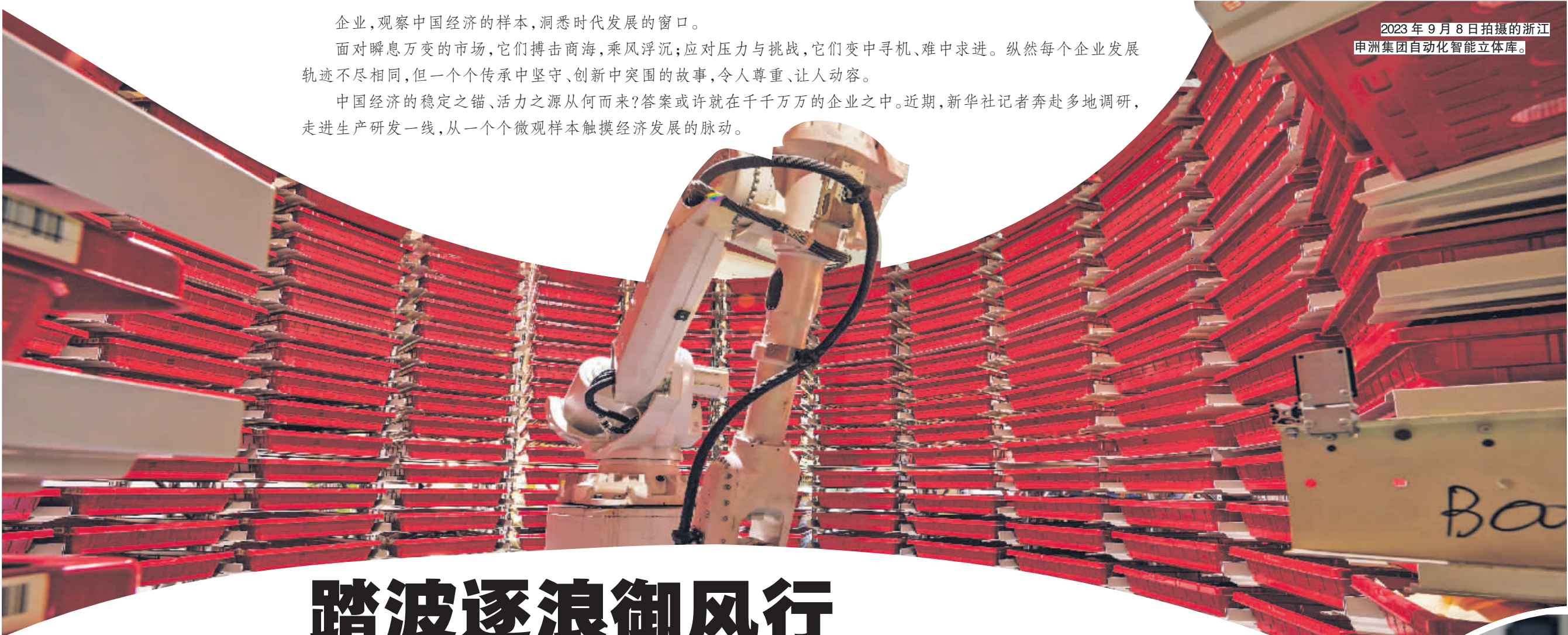
2023年9月8日拍摄的浙江申洲集团自动化智能立体库。

企业,观察中国经济的样本,洞悉时代发展的窗口。面对瞬息万变的市场,它们搏击商海,乘风破浪;面对压力与挑战,它们变中寻机、难中求进。纵然每个企业发展轨迹不尽相同,但一个个传承中坚守、创新中突围的故事,令人尊重、让人动容。中国经济的稳定之锚、活力之源从何而来?答案或许就在千千万万的企业之中。近期,新华社记者奔赴多地调研,走进生产研发一线,从一个个微观样本触摸经济发展的脉动。