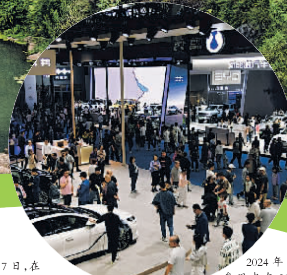
2024年10月1日,参观者在2024第十九届西安国际车展参观新能源汽车。