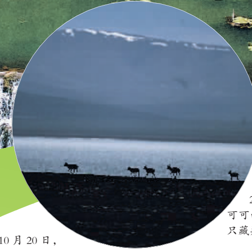
2024年7月7日,在可可西里卓乃湖区域,几只藏羚羊在活动。