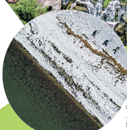
2021年10月20日,在青海省果洛藏族自治州玛多县扎陵湖乡勒那村,三江源国家公园黄河源园区生态管护员在巡护(无人机照片)。

党的十八大以来,西部地区深入贯彻落实习近平生态文明思想,牢固树立践行“绿水青山就是金山银山”的理念,统筹推进高质量发展和高水平保护,不断加大快治理、加大保护,绿色发展不断提速,绿色版图持续拓展,绿色产业蓬勃向上,汇聚起筑牢国家生态安全屏障的磅礴力量。