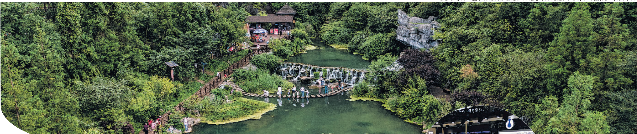
游客在贵州六盘水明湖国家湿地公园观光游玩(2024年8月7日摄,无人机照片)。

这是幅员辽阔的西部地区。从昆仑山、秦岭到喜马拉雅山,从青藏高原、黄土高原到云贵高原,从黄河、长江到雅鲁藏布江……涵盖12个省区市,占全国国土面积七成多,西部地区分布着草原、湿地、湖泊、森林等重要生态资源,却也面临着异常脆弱的生态环境,对保障国家生态安全和实现可持续发展意义重大。