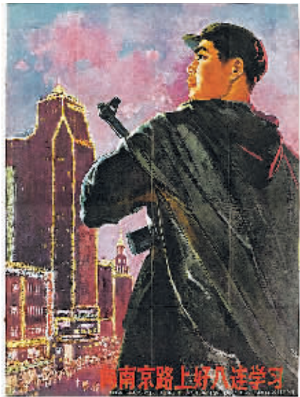
连环画《向南京路上好八连学习》。