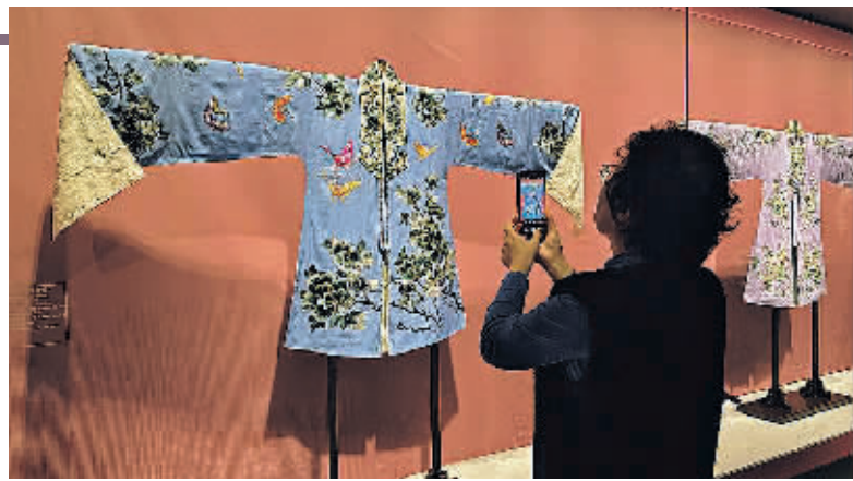
观众在参观展览。