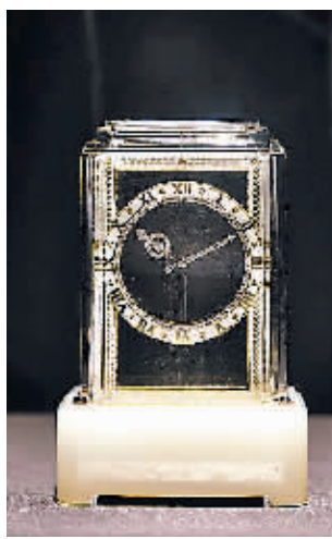
Model A 神秘钟。