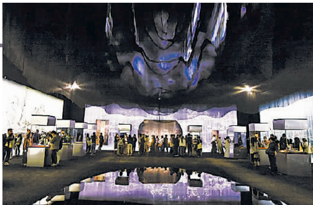
上博东馆一楼展厅。