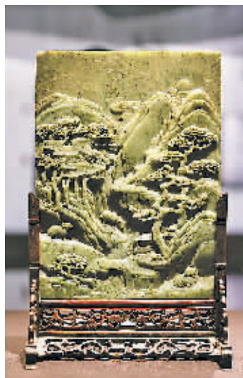
三阳开泰碧玉插屏。