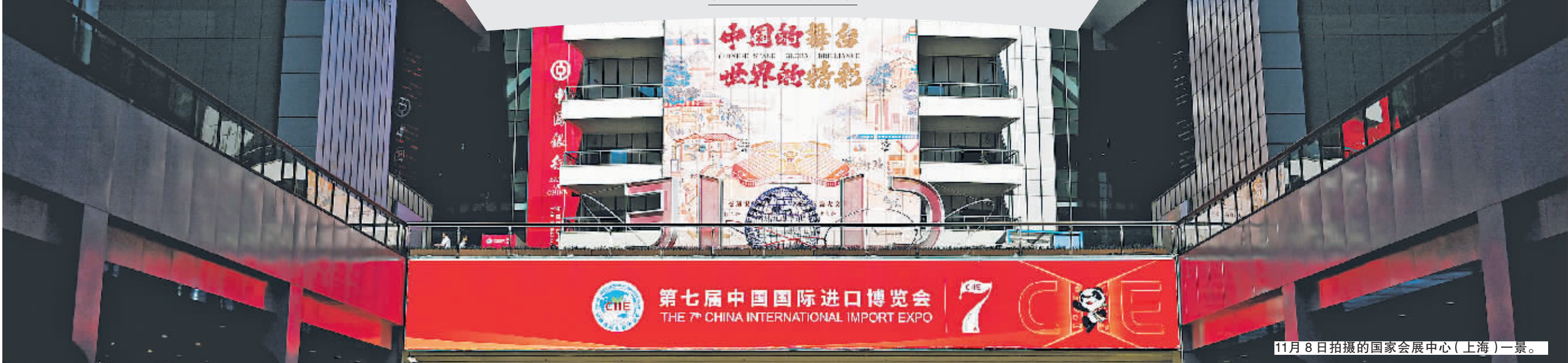
11月8日拍摄的国家会展中心(上海)一景。