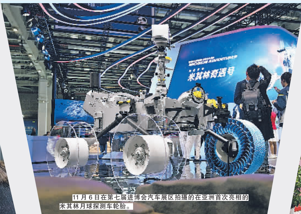
11月6日在第七届进博会汽车展区拍摄的在亚洲首次亮相的米其林月球探测车轮胎。