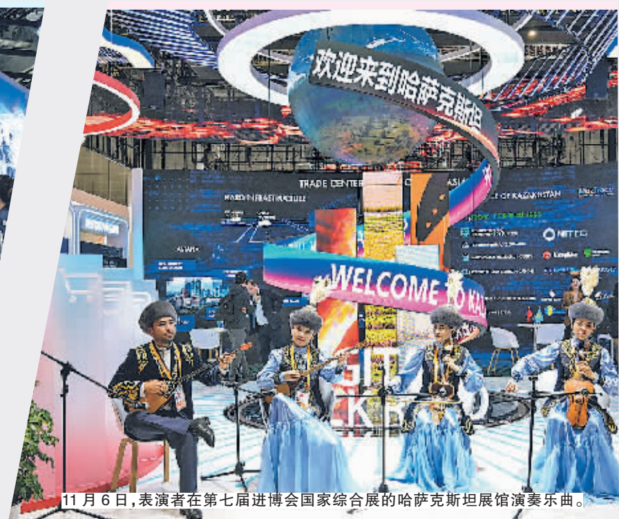
11月6日,表演者在第七届进博会国家综合展的哈萨克斯坦展馆演奏乐曲。