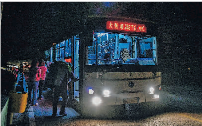
在水田镇定点村，菜农登上252路“惠农专线”公交车，准备进城卖菜(11月7日报)。