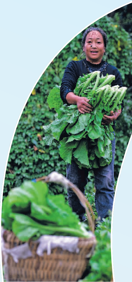
下坝镇下坝村村民在地里摘菜，准备第二天进城售卖(11月6日报)。