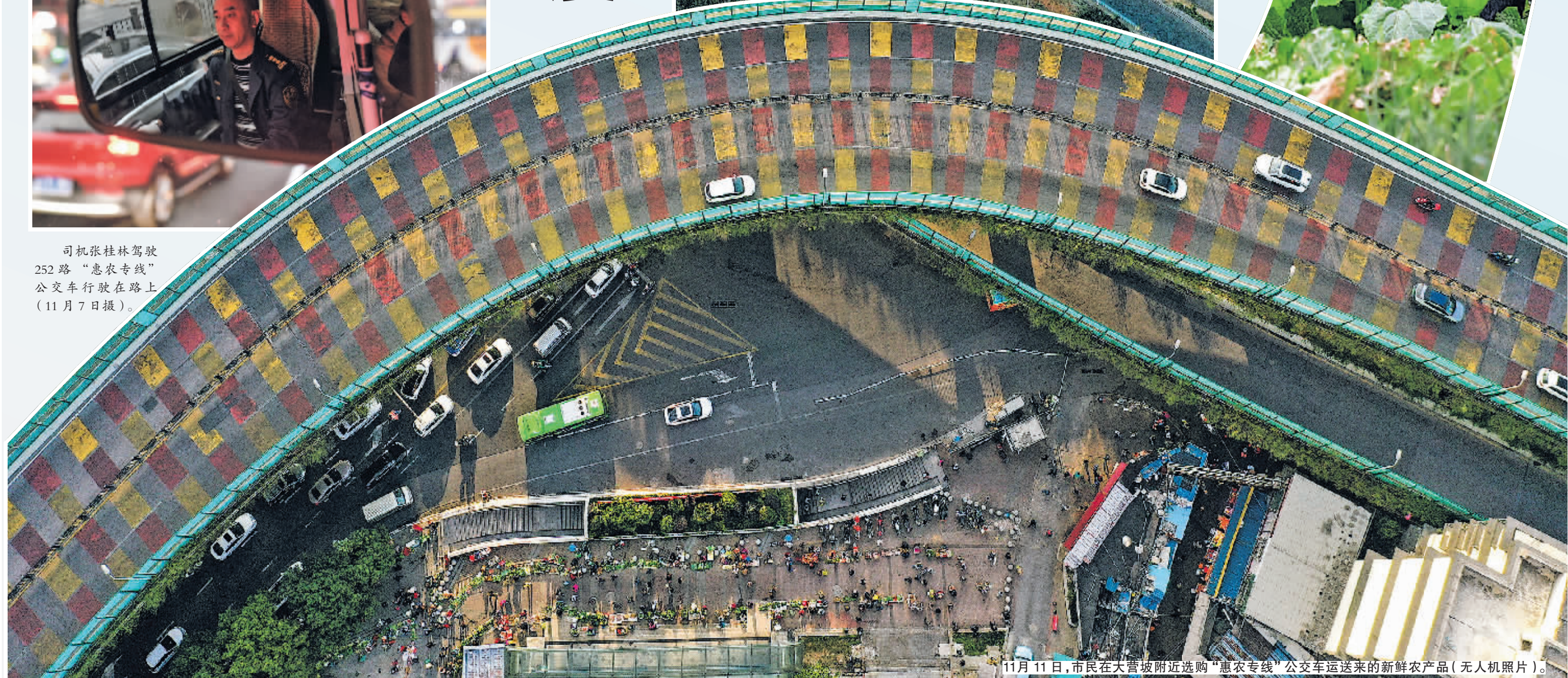
11月11日，市民在大营坡附近选购“惠农专线”公交车运送来的新鲜农产品(无人机照片)。