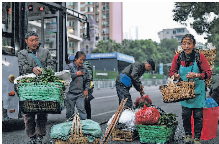
菜农乘坐252路“惠农专线”公交车抵达大营坡终点站(11月7日报)。