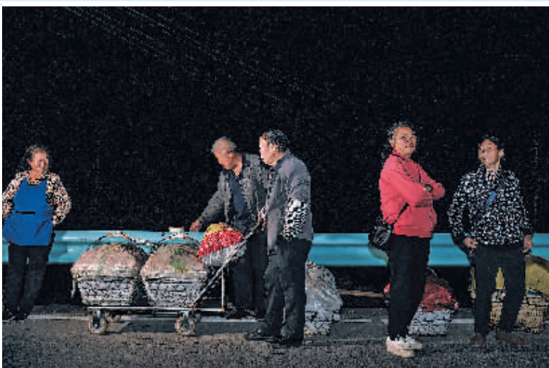
村民在水田镇定点村候车，准备乘坐252路“惠农专线”公交车进城卖菜(11月7日报)。