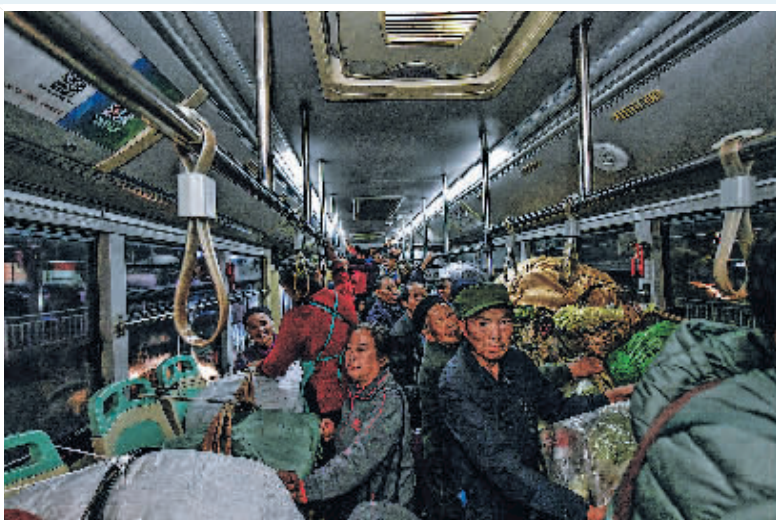
252路“惠农专线”公交车车厢里的场景(11月7日报)。