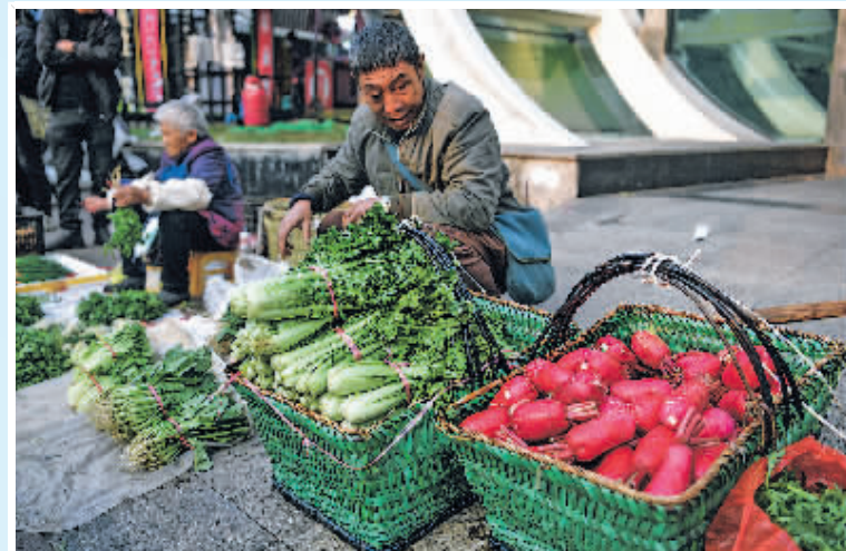
乘坐252路“惠农专线”公交车进城的菜农在大营坡附近卖菜(11月7日报)。