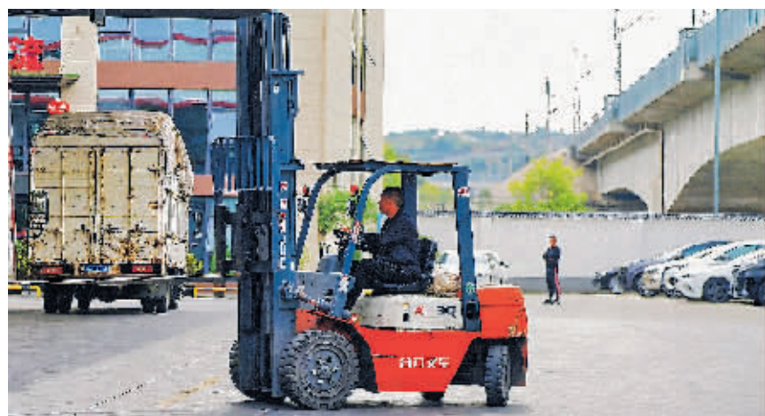
物流企业员工在西南国际商贸城接收货物。

“友联物流和鑫湘瑞物流两家企业虽然表面上竞争激烈,但实际上各有千秋,互补性强。友联物流客户关系维护得特别好,所以在前端收货方面拥有较大的优势,鑫湘瑞物流则在干线和末端配送上拥有出色的表现,更适合做末端。”中泰物流联合创始人王志发说。