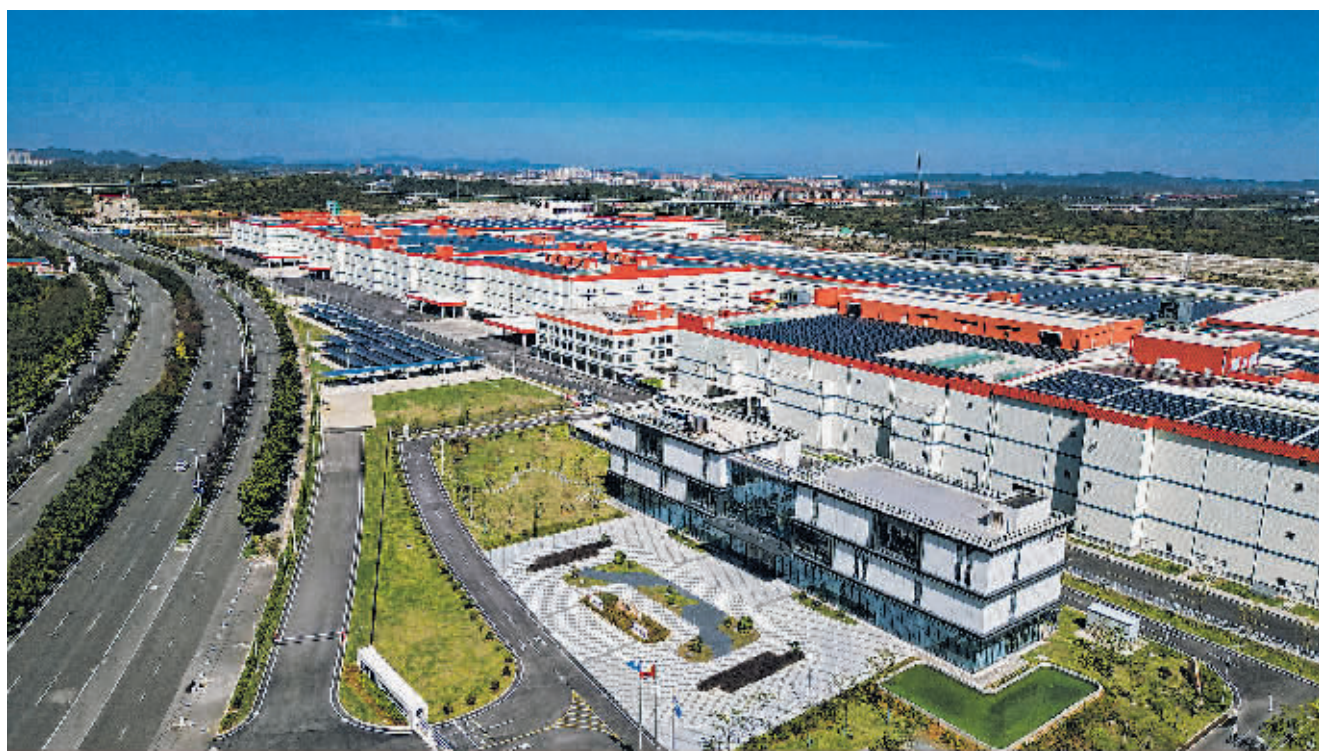
俯瞰位于贵安新区的宁德时代贵州基地。

2023年10月27日,宁德时代贵州基地投产,仅用一年时间,已建设成为目前全球工艺最先进、自动化、智能化程度最高的电芯生产线,并获得PAS2060碳中和认证,正式跻身“零碳工厂”行列。今年4月,中车贵阳贵安时代绿色装备产业基地在贵安新区高端装备制造产业园投产。今年9月,贵安发展·光谷算力产业园与贵安新区机器人创新产业园正式揭牌。作为贵安新区本土成长起来的国有控股汽车生产企业,贵州长江汽车有限公司发力新能源商用车两年多来,获批国家高新技术企业、贵州省