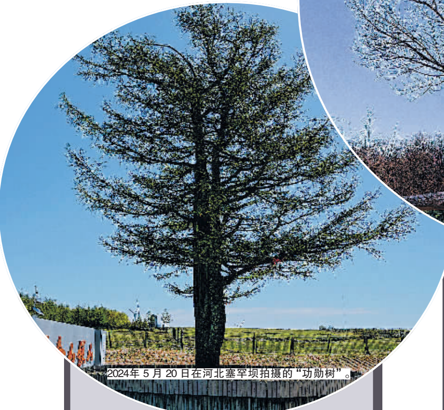
2024年5月20日在河北塞罕坝拍摄的“功勋树”。

党的二十届三中全会明确要求“聚焦建设美丽中国,加快经济社会发展全面绿色转型”。新的历史方位,新的奋斗征程,再次走近“三棵树”,历久弥新的精神之力扑面而来,催人奋进。