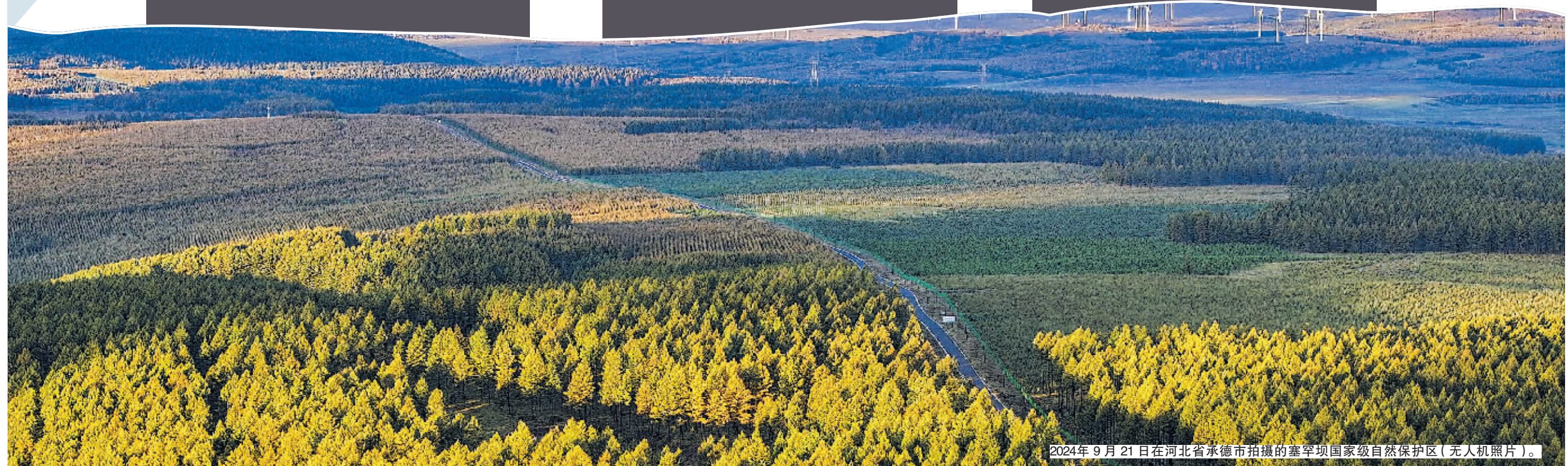
2024年9月21日在河北省承德市拍摄的塞罕坝国家级自然保护区(无人机照片)。

站在历史的新征程上,“三棵树”所凝结的精神力量,跨越山河、激荡回响。在绿色绵延中,它们不断见证“绿水青山就是金山银山”的生动实践,也必将见证一代代人在人与自然和谐共生的现代化答卷中继续书写浓墨重彩的新篇章。