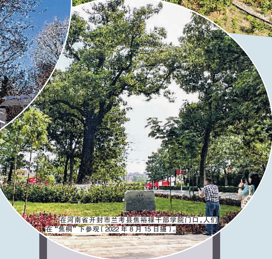
在河南省开封市兰考县焦裕禄干部学院门口,人们在“焦桐”下参观(2022年8月15日摄)。