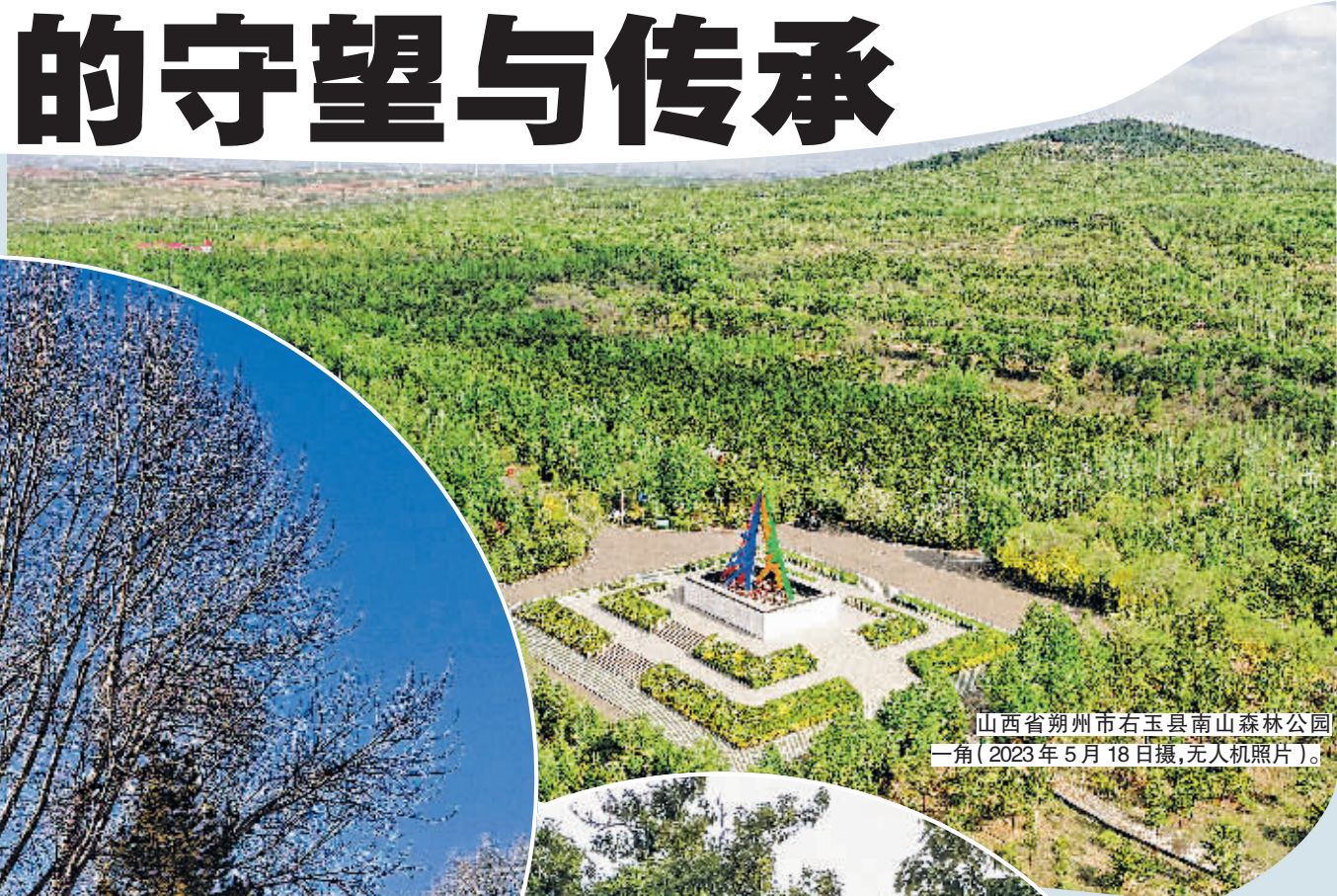
山西省朔州市右玉县南山森林公园一角(2023年5月18日摄,无人机照片)。