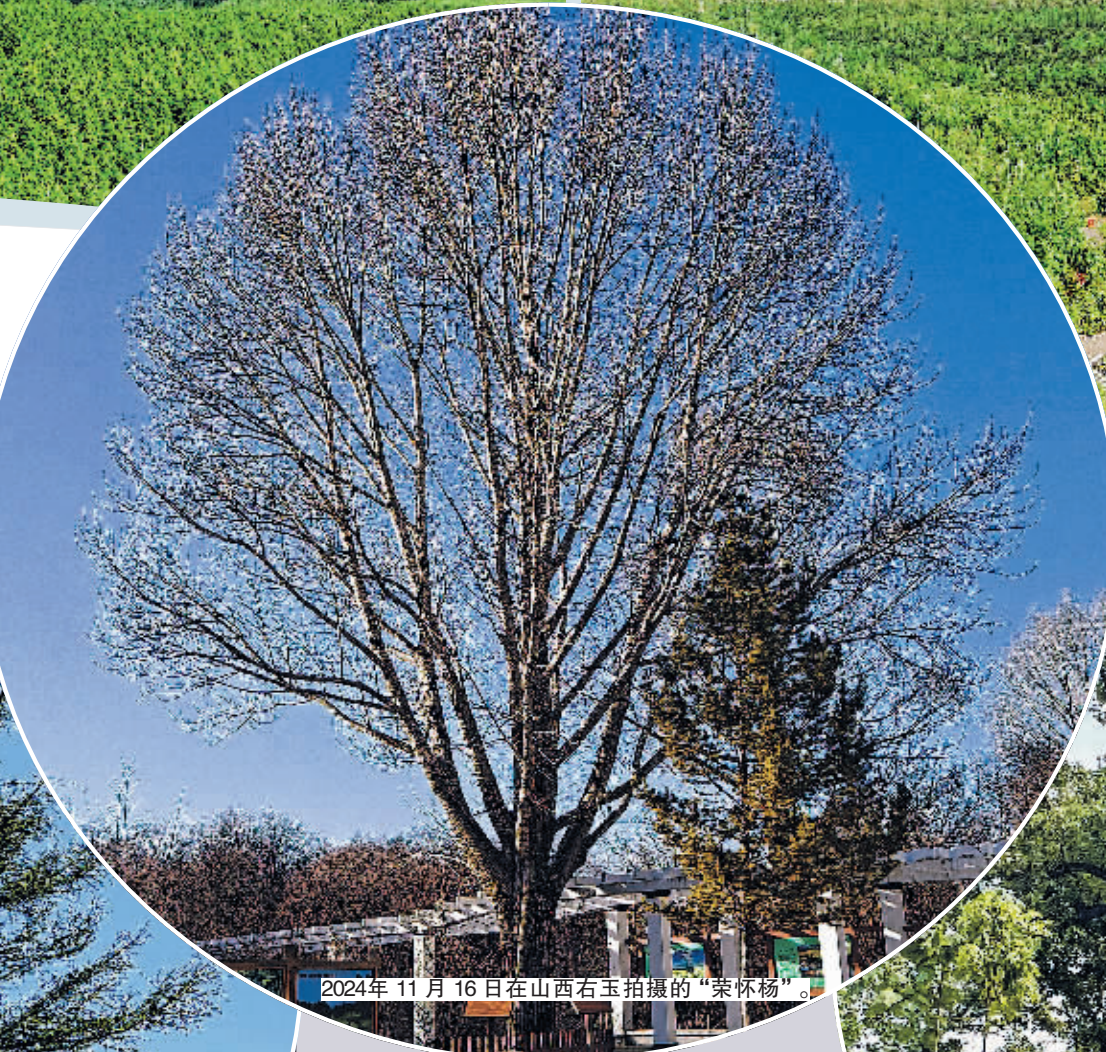
2024年11月16日在山西右玉拍摄的“荣怀杨”。