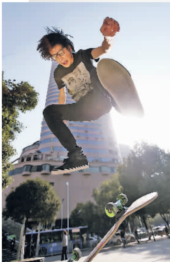
▲在大十字广场上,苦练滑板技巧的年轻人,为城市增添了一份青春与活力。