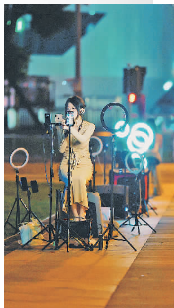
▲夜晚,在花果园兰花广场上,进行直播的年轻人。