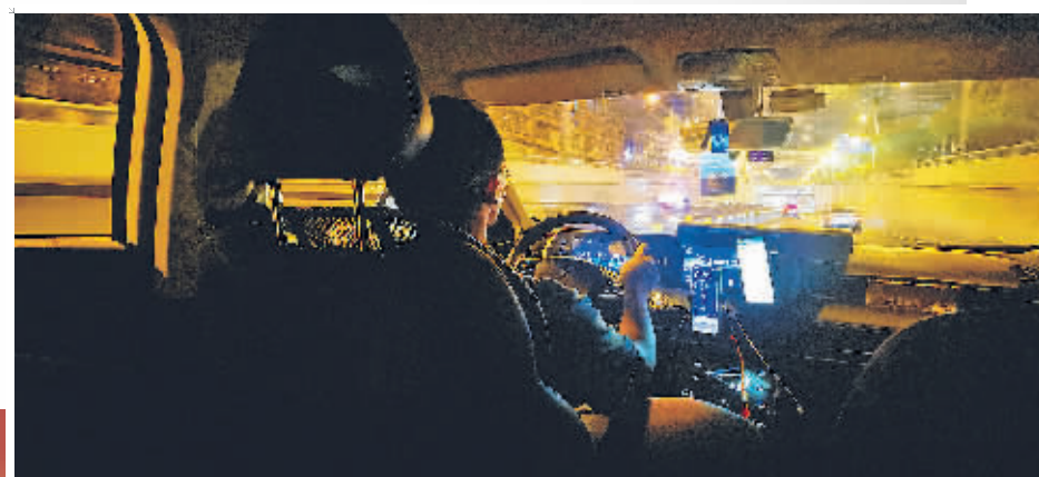
▲穿梭在城市各个角落的网约车司机,为晚归的市民提供便捷出行。