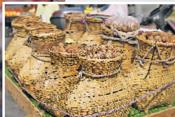
▲农贸市场里的竹篮装的不仅是农产品,更是一座城市的市井烟火味儿。