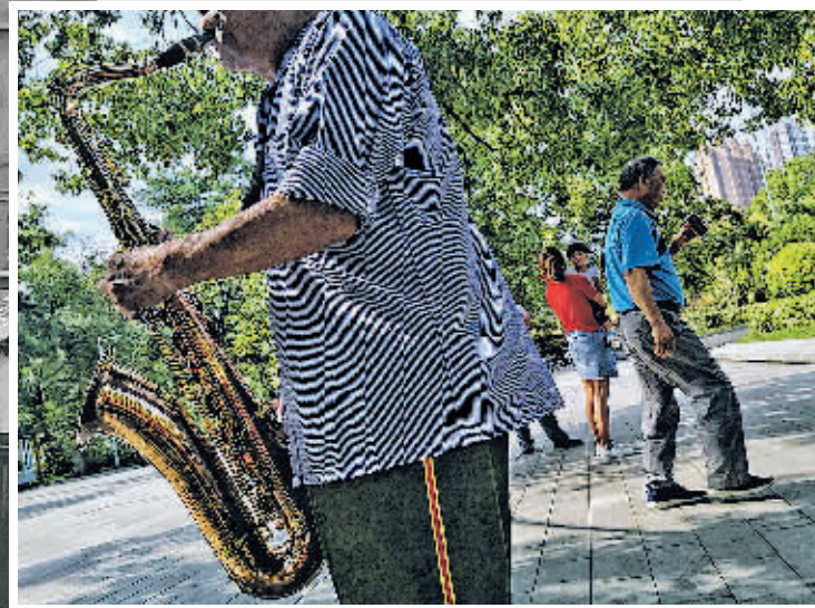
▲在阿哈湖国家湿地公园里,市民悠闲地吹奏萨克斯。