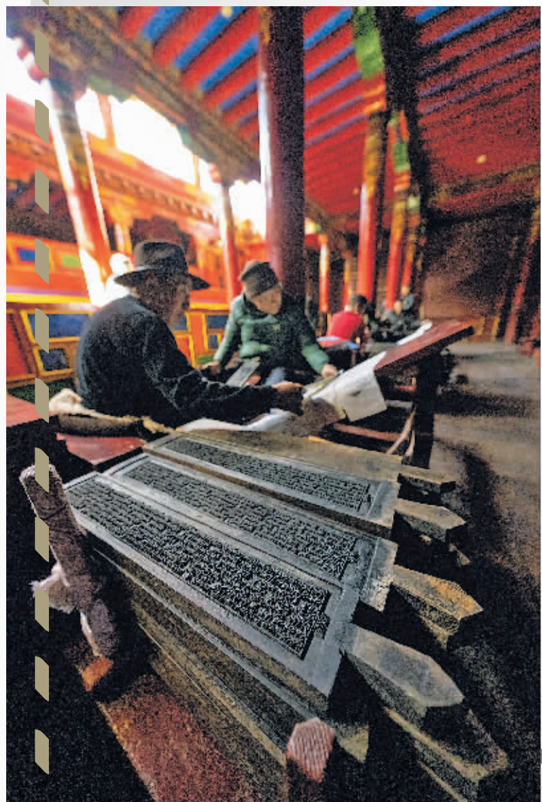
使用院藏印版印刷。