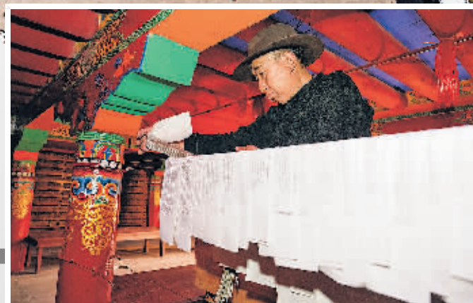
晾晒印完的印刷品。