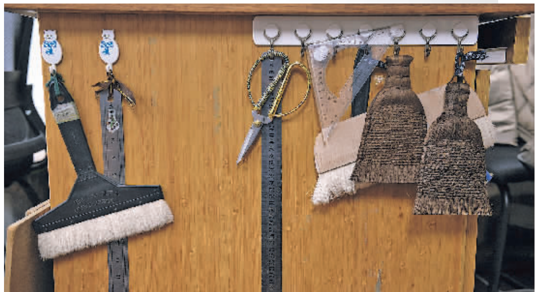
古籍修复师的修复工具。