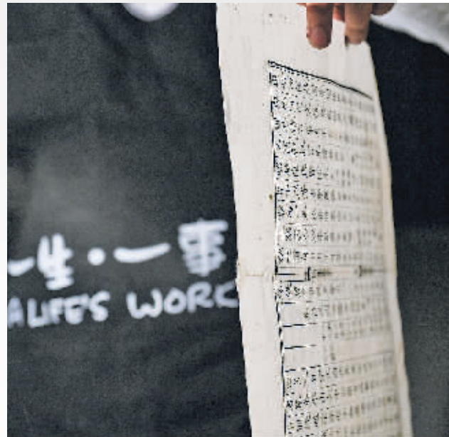
将修补完成的书齐栏撒齐。