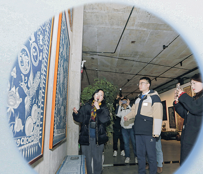
大V在手上记忆博物馆参观