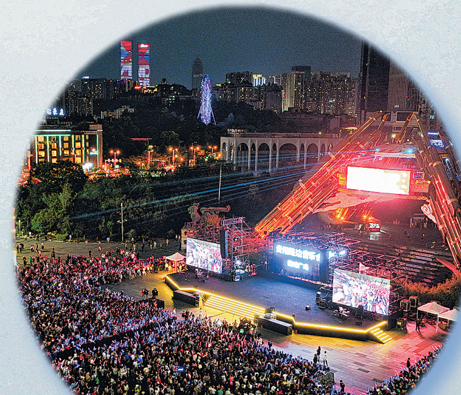
贵阳路边音乐会“唱响”