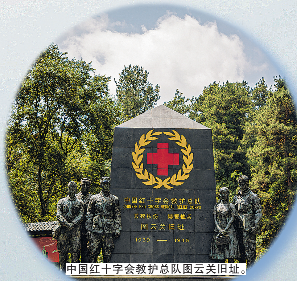
中国红十字会救护总队旧址