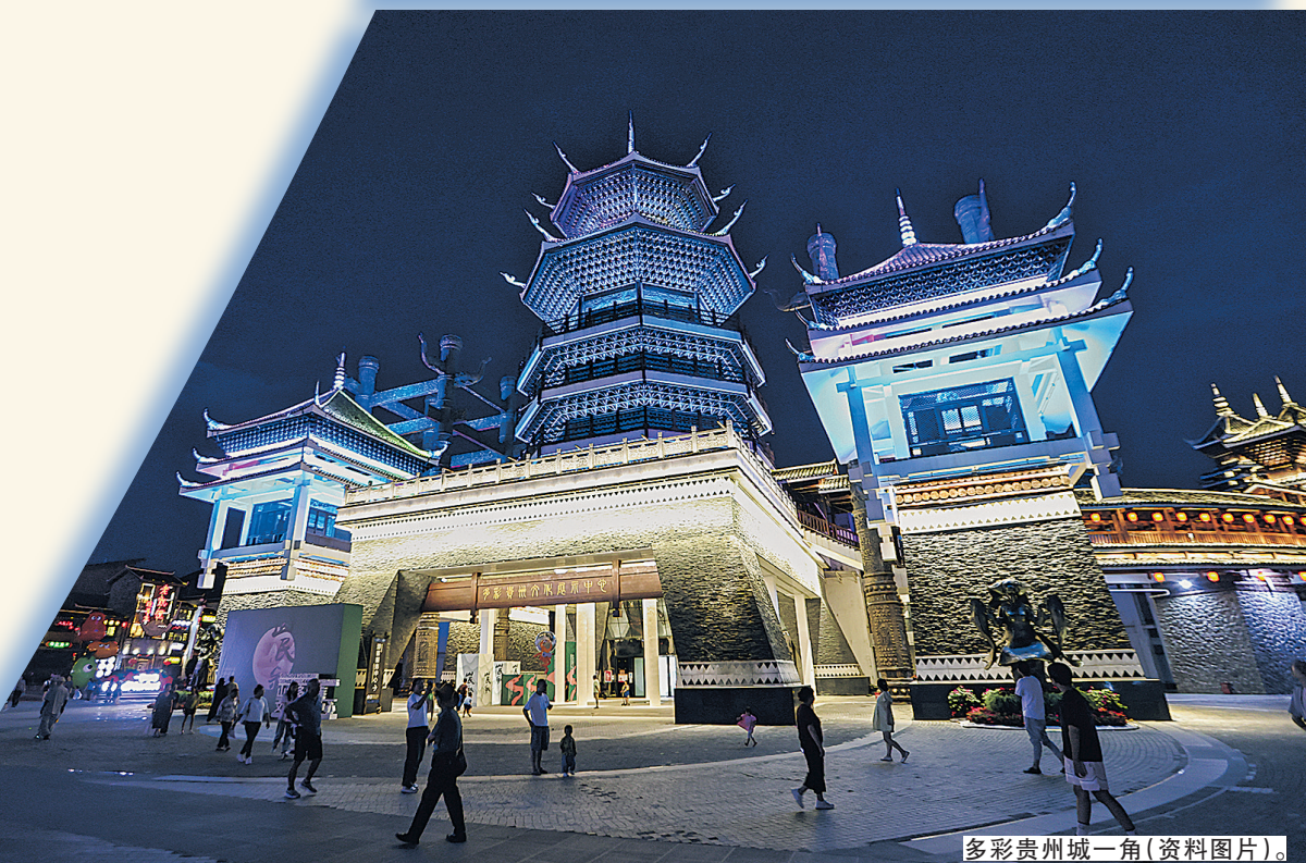
多彩贵州城一角(资料图片)