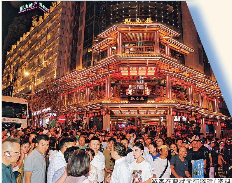
游客在曹状元街游玩(资料图片)