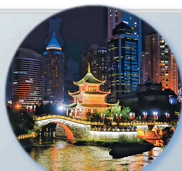
灯光璀璨的甲秀楼