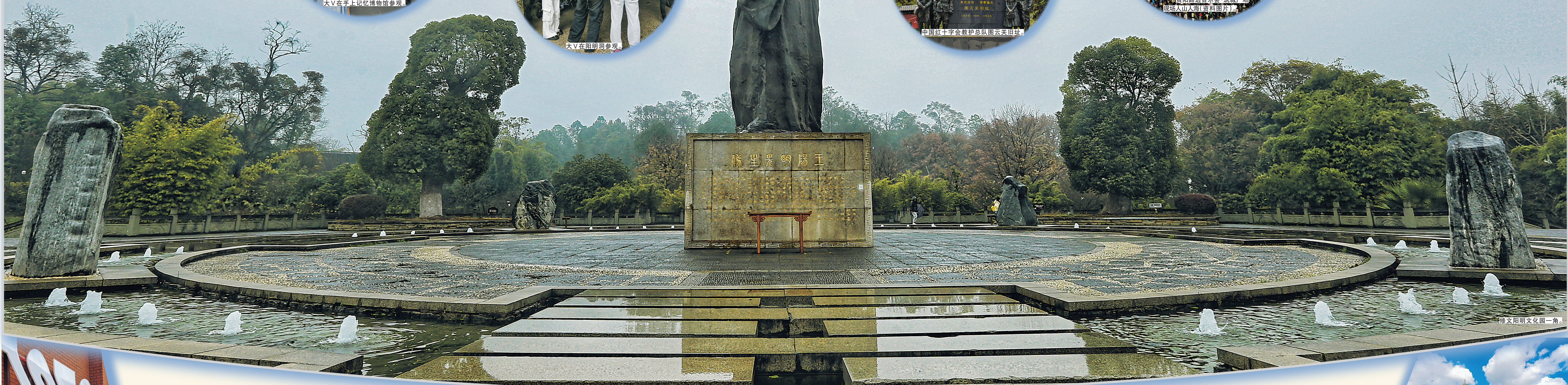
修文阳明文化园一角

12月21日启动的“探寻历史风貌·追溯筑城底片”——媒体大V贵阳贵安采风行活动,吸引了来自省内外的40多家主流媒体代表与众多网络大V参加。在连续两天的采风活动中,媒体记者和网络大V们聚焦历史文化、民族文化、阳明文化、红色文化、群众文化,用镜头捕捉精彩瞬间,用声音传播贵阳故事,用文字深挖城市底蕴,全方位、多角度展现贵阳贵安的“六爽”魅力。