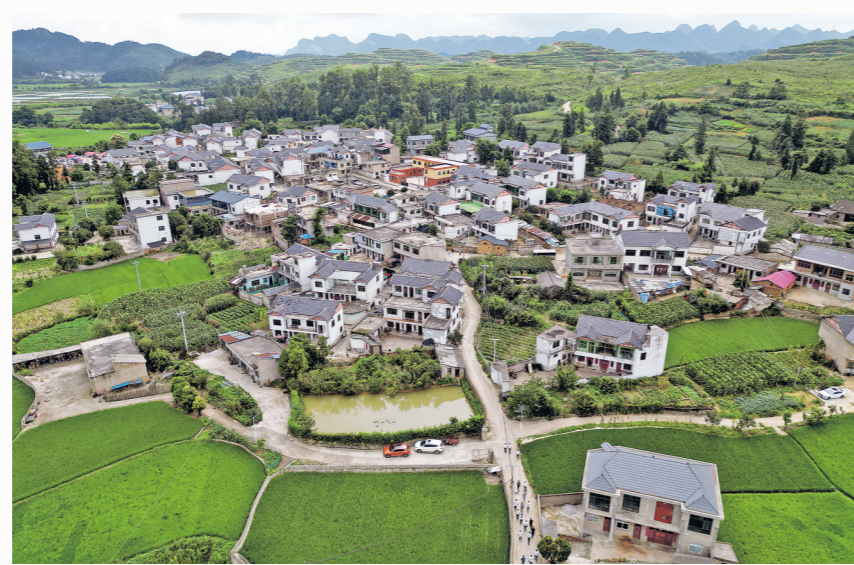
俯瞰岩孔村(2024年8月摄)。

针对组织不完善、凝聚力不强等问题，岩孔村更换党支部书记，罗洪礼就是此时当选为村党支部书记的。同时，及时补选了村党支部委员1名、村委会成员2名。其中，两名村委会成员年龄只有35岁左右，具有大学本科学历。“年龄降下来，学历升上去。”罗洪礼说，当时考虑的不仅仅是单纯的年轻化问题，35岁这个年纪已经有一定的生活