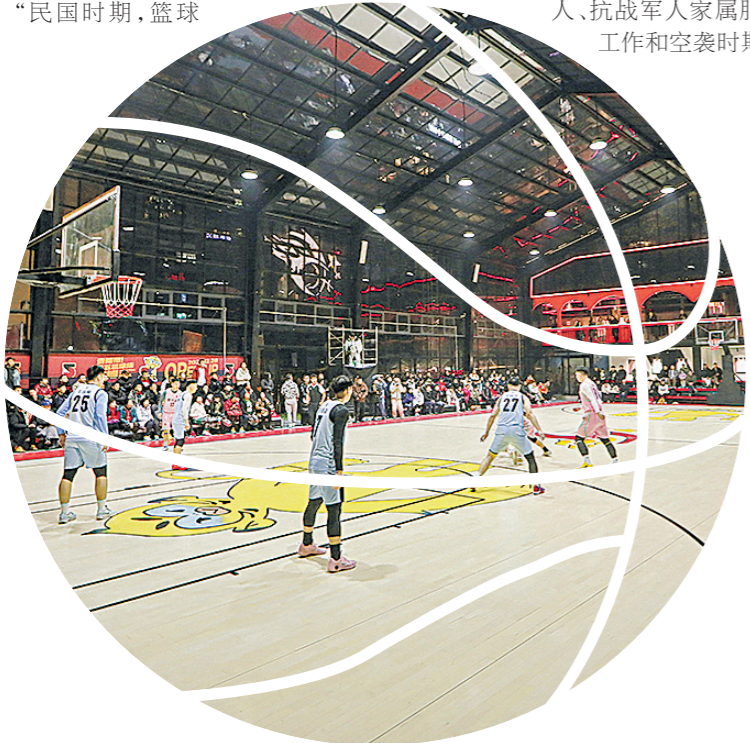
改造提升后的第五篮球场。