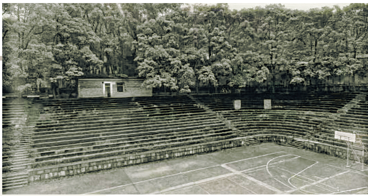
贵阳市第五篮球场旧照。