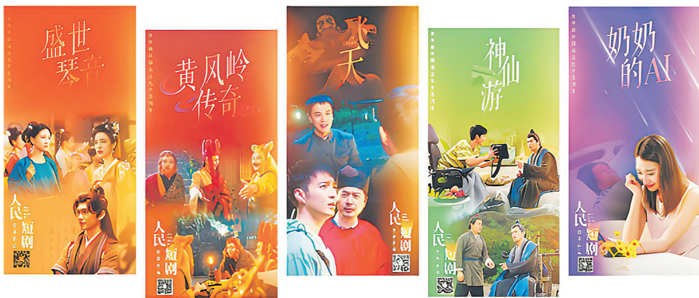
《飞天》《盛世琴音》《黄风岭传奇》《神仙游》《奶奶的AI》海报。