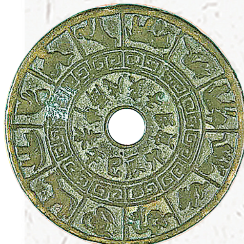
宋代十二生肖压胜钱。 故宫博物院藏