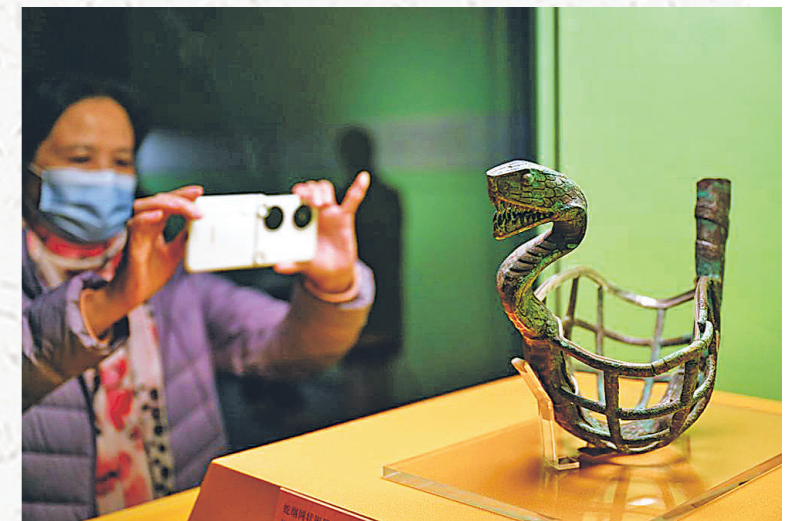
观众在上海博物馆蛇年迎春展拍摄展品蛇网状铜器。