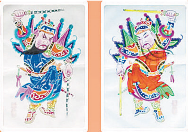
清代《双扬鞭》年画。 绵竹年画博物馆藏