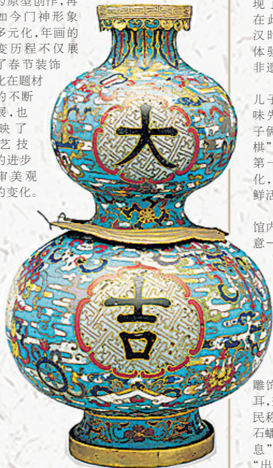
清代掐丝珐琅八吉祥纹大吉葫芦瓶。 故宫博物院藏

在发展中创新、在创新中发展,春节文化不断被赋予新的时代内涵。收藏于绵竹年画博物馆的年画《双扬鞭》,生动描绘了秦琼与尉迟恭两位门神的威严形象。画面中,他们手执鞭、挺胸凸肚,目光炯炯,威然挺立,形象地展现了门神镇宅辟邪的重要作用。从一开始简单地门上绘制神荼、郁垒等形象,到唐代以秦琼、尉迟恭为原型创作,再到如今门神形象的多元化,年画的演变历程不仅展示了春节装饰文化在题材上的不断拓展,也反映了工艺技术的进步和审美观念的变化。