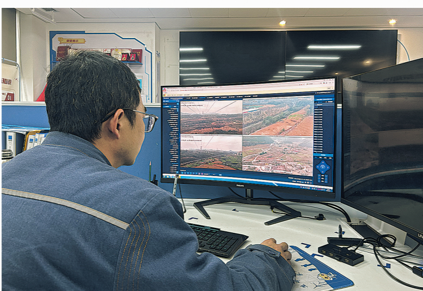
贵安供电局工作人员在查看实时监控画面。