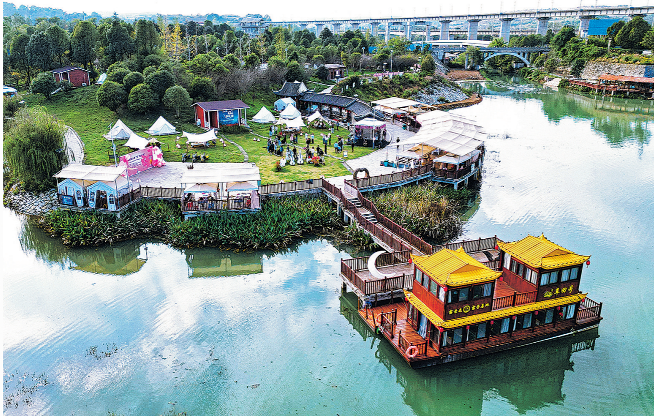
湖潮乡车田村露营基地一景。

党武街道掌克村拥有8.6万株300年以上的古茶树,是远近闻名的“古茶村”。为了扩大生产规模,近年来,掌克村不断推动“古茶二代”的种植。2024年,掌克村“古茶二代”茶树种植面积占全村茶树种植面积的三分之一。“全村仅卖茶青的年收入就能达到300万元至700万元。”掌克村党支部书记张兴国说,2024年,掌克村新的生产车间投用,古茶的产量和品质再次得以大幅提升,现在村民们种茶的积极性越来越高。