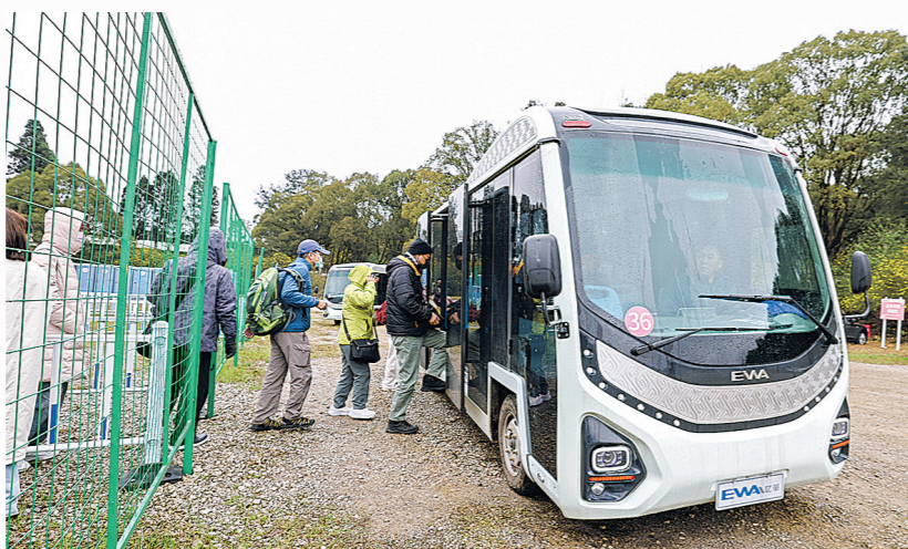
在贵安樱花园游客集散中心,游客有序乘坐观光车。

点,目前主要集中在樱花园的北部客流密集区域,而南部区域有4个厕所,且均设置有引导牌,游客可根据引导牌指引前往。