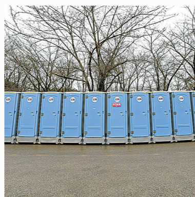
贵安樱花园内的移动公厕。