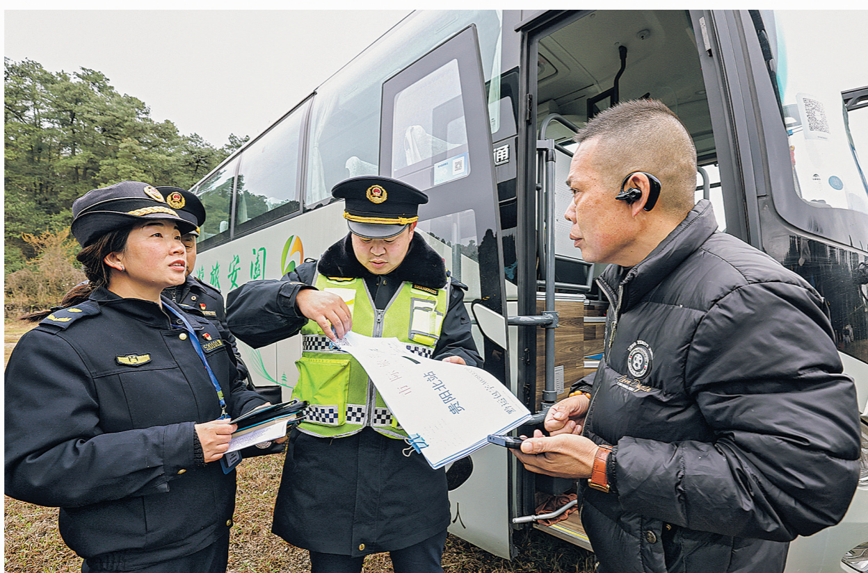
贵安新区多部门在樱花园停车场及周边交通枢纽开展交通联合执法专项行动。

为保障游客如厕需求,今年整个园区投入了100个水冲式移动公厕,且移动公厕根据游客的需求进行布