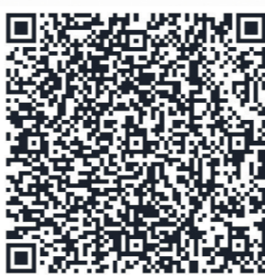
扫码解锁更多“花式”玩法 游贵安赏美景 品美食