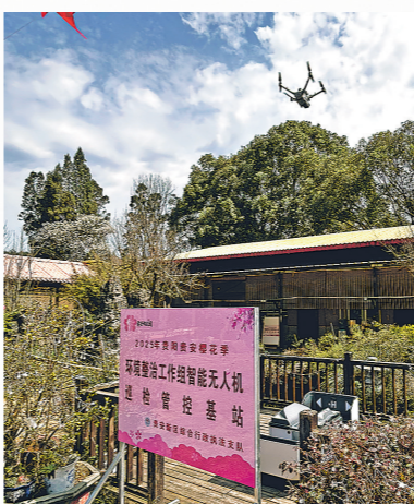
智能无人机从巡查管控基站起飞。