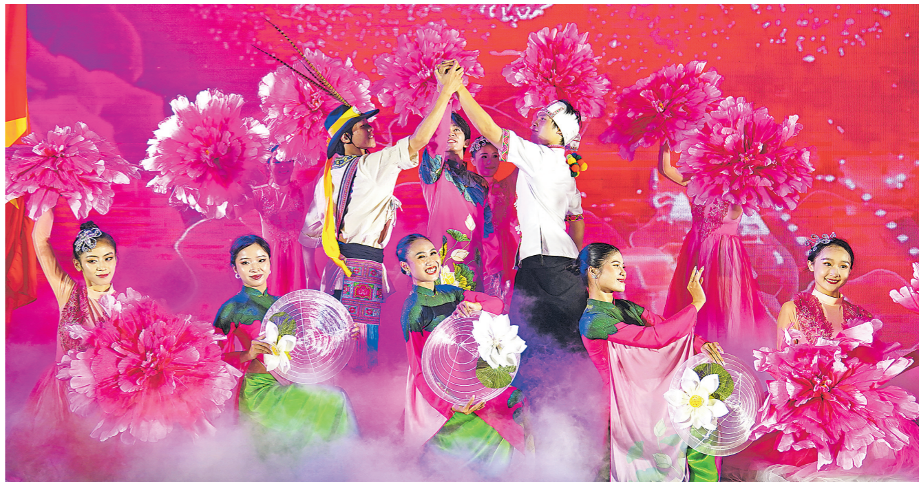
2024年9月16日,在越南胡志明市,艺术家在中越跨国中秋晚会上表演。

中央周边工作会议后,习近平主席即将开启2025年首次出访,中国特色大国外交在周边谱写新篇章。