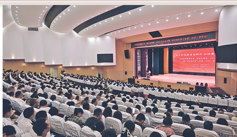
教育家精神宣讲会。