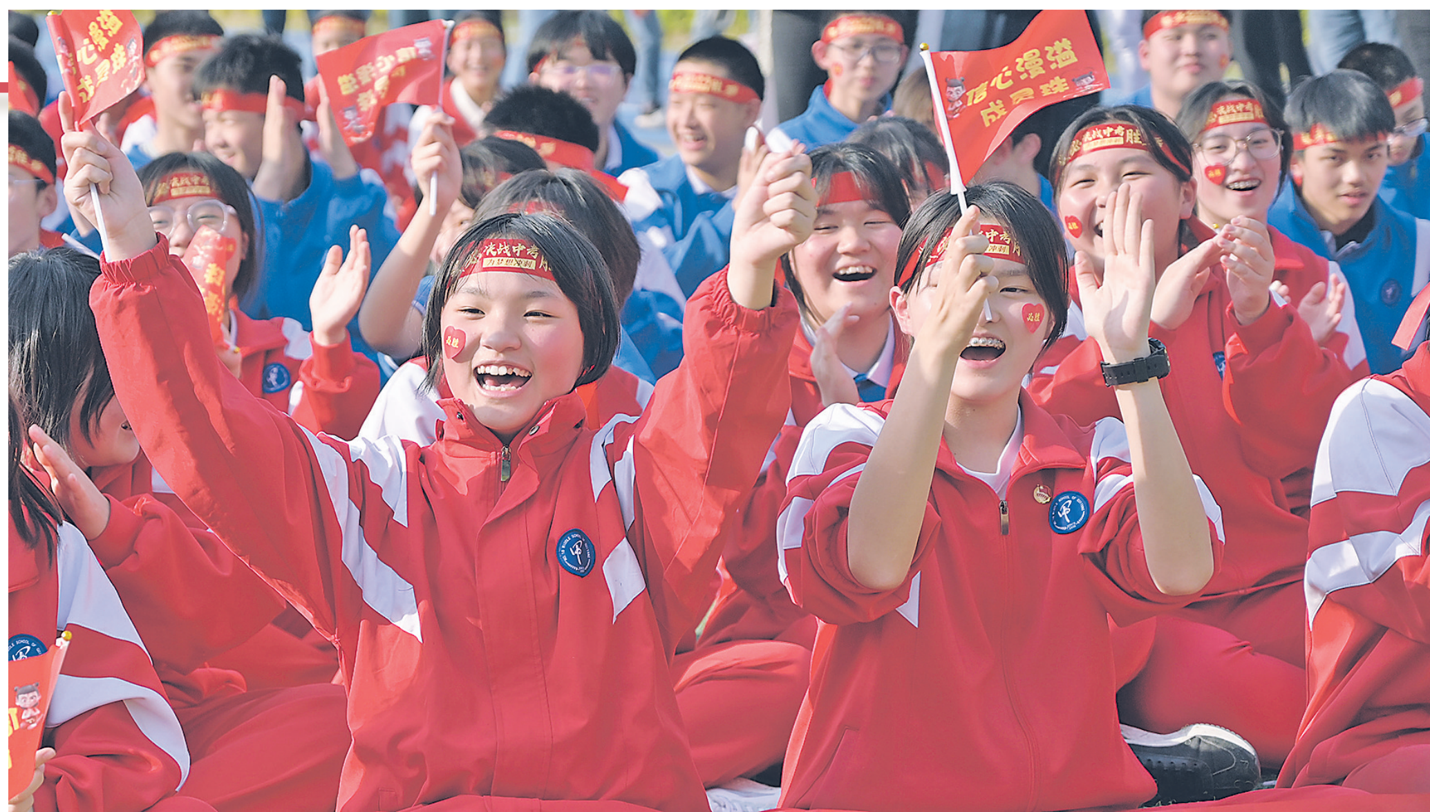
朝气蓬勃的贵阳学子。

这里,正成为一片初心闪耀、芳华绽放的热土,广大教师以砥砺前行之姿,共同奏响为党育人、为国育才的时代强音。