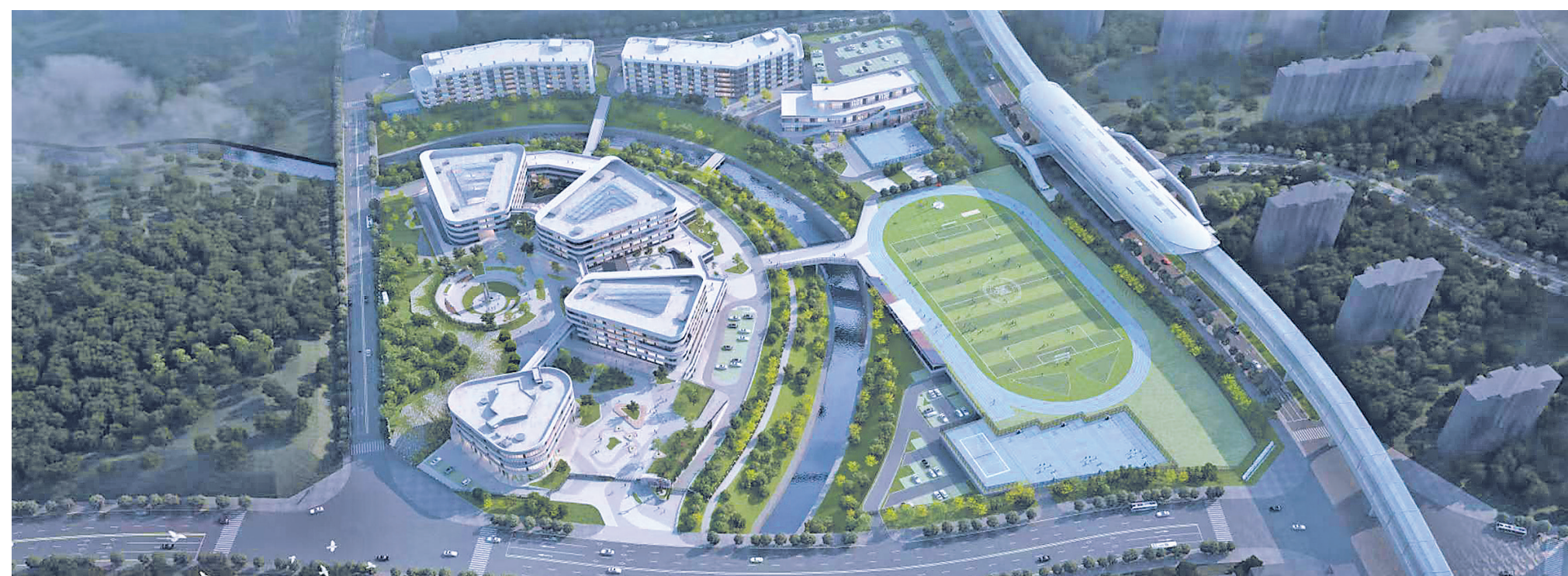
正在建设中的华东师范大学附属贵阳高级中学。