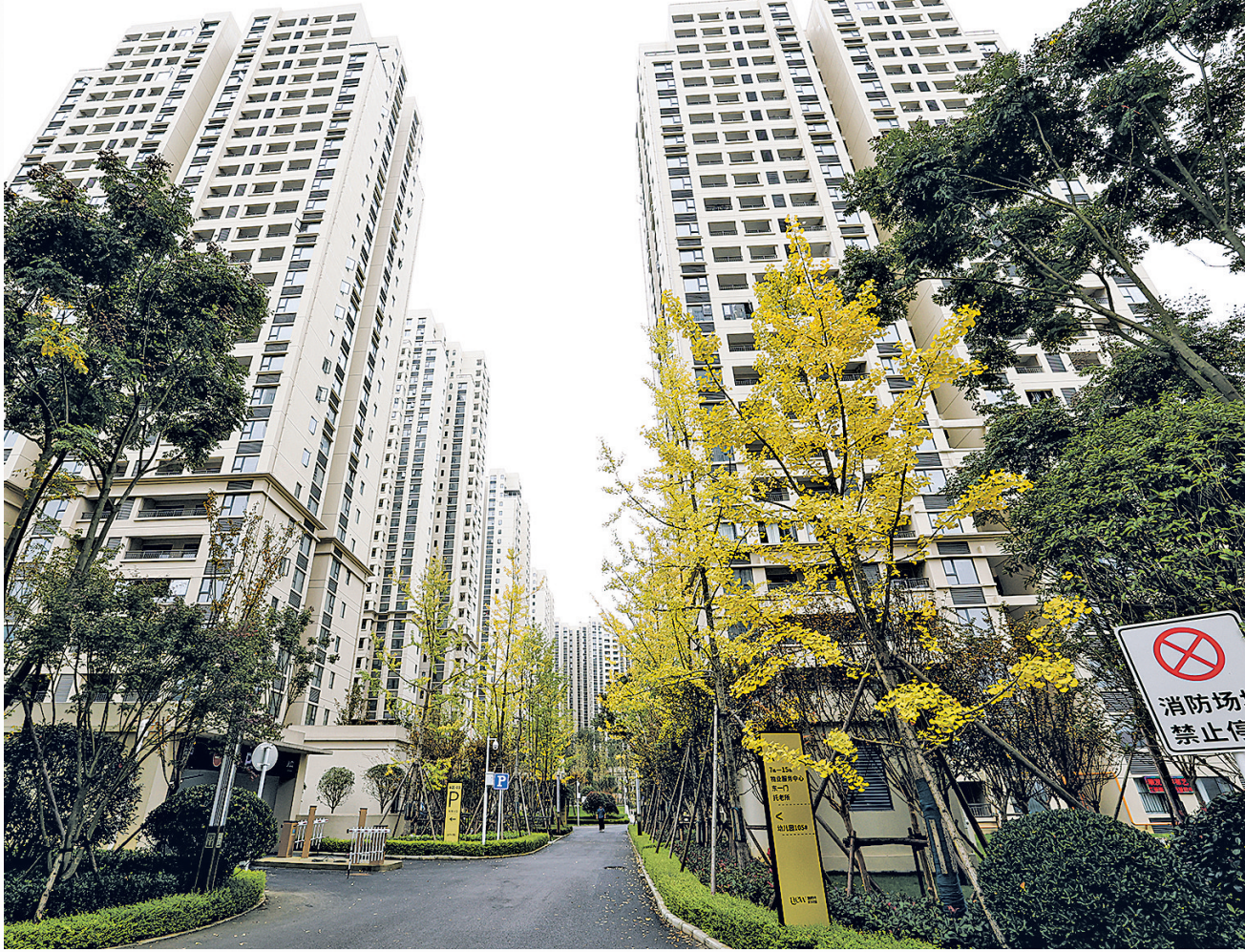
贵安新区时代花园项目一角。

作为贵安新区人才政策体系的重要组成部分,“补贴租”政策已进入常态化实施阶段,其惠民成效在前期实践中得到充分印证。今年8月6日,新区探索推出首批翰林园项目100套“补贴租”人才保障房,1个月内全部租罄。“我是通过“贵安人才通”小程序进行线上申请的,10分钟不到就完成了,特别方便。”住户李女士说,不仅申请便捷,周边配套齐全,取快递、买菜、看电影等步行几分钟就能到达。在性价比方面,住户白先生算了一笔账:“享受补贴后租金比市场价便宜三分之一以上。”住户李女士还提到,中秋节,小区组织了丰