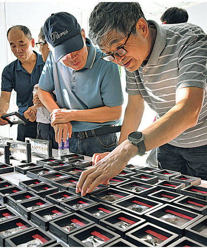
▲考古专家在三亚落笔洞遗址观察出土标本。 ▲三亚落笔洞遗址发掘现场。

目前,落笔洞遗址的发掘工作仍在进行中,后续海南省文物考古研究院和北京大学考古文博学院等单位组成的多学科研究团队将重点开展遗址