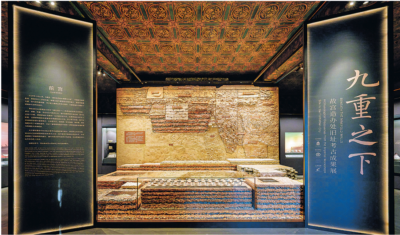
“九重之下——故宫造办处旧址考古成果展”一角。