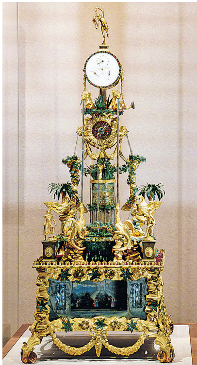
展出的铜镀金乐箱水法跑人双马驮钟。

清宫造办处是清宫内务府的下属机构之一,负责宫廷御用品的制造、买办、维修、贮藏等。2020年10月以来,故宫考古研究所连续五年对造办处旧址区域开展科学发掘工作,揭示出元代、明早期、明中晚期、清早期、清中晚期共五个时期的遗存,形成了紫禁城内面积最大、时代序列最完整的考古发现。这片紧邻三大殿的区域,如今成为解读北京“古今