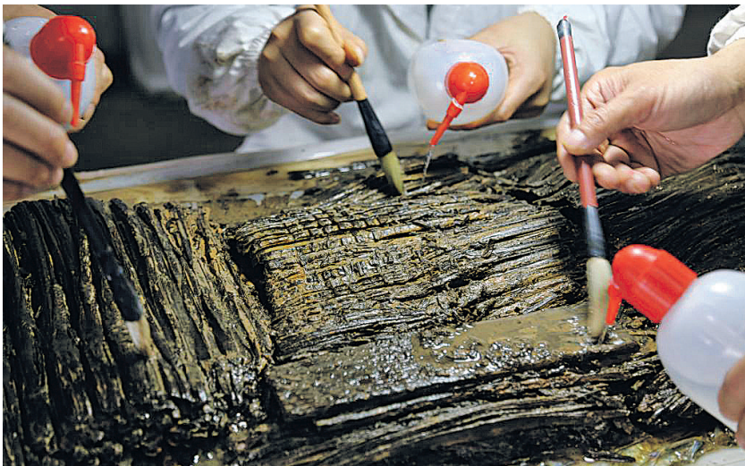
文保人员正在进行竹简保护工作。

“海昏侯墓出土简牍研究”课题组成员、中国社会科学院古代史研究所先秦史研究室研究员杨博介绍,2018年底,他们通过红外照片初步辨认出几种古代典籍的失传版本或较早版本,如失传1800余年的《齐论语》、存字最多的《诗经》古本、前所未见的《易占》占卜类文献等。未来,随着文保修复工作的深入,或能填补更多历史空白。