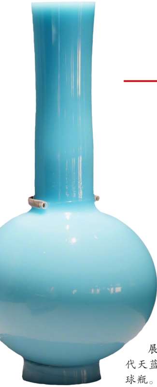
展出的清代天蓝玻璃天球瓶。

与之呼应的“做钟处”,则展现了另一种精密技艺与文明交融。约200件出土钟表配件,种类丰富,制作精美。“做钟