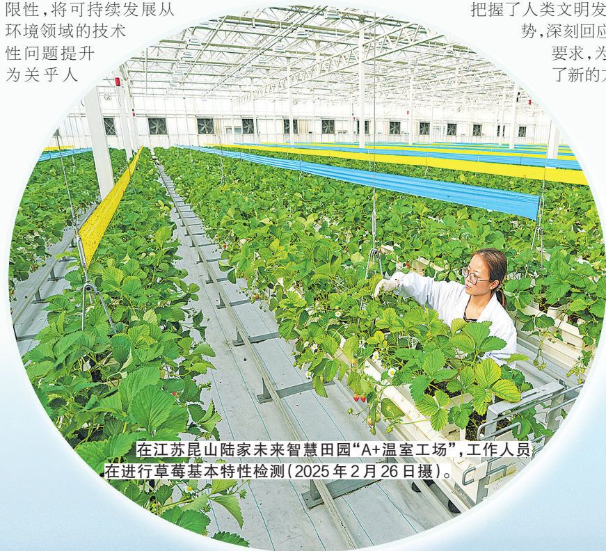
在江苏昆山陆家未来智慧田园“A+温室工场”,工作人员在进行草莓基本特性检测(2025年2月26日摄)。

创造人类文明新形态。这一思想从根本上解决了工业文明内在的不可持续性问题,准确把握了人类文明发展的历史规律和历史趋势,深刻回应了文明形态跃升的时代要求,为人类文明永续发展指明了新的方向。